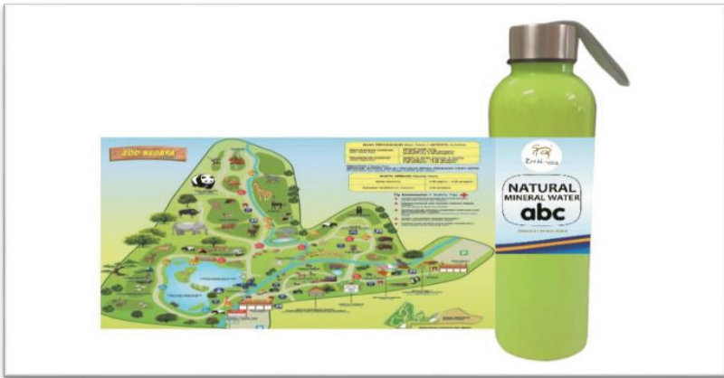
Rajah 4: Botol ZIBMAP Beserta Peta Laluan Dalam Zoo Negara

Rajah 3 menunjukkan label fakta nutrisi dan maklumat kualiti nutrisi. Maklumat nutrisi ini penting kepada industri pemakanan khususnya, pengeluar dan peruncit makanan bagi memberi kesedaran kepada pengguna mengenai kepentingan komponen nutrisi dalam produk makanan (Tee, 2017). Label fakta komponen nutrisi turut mempamerkan destinasi pelancongan, jenama, gambar dan lain-lain pernyataan penting seperti logo standard amalan penggunaan Teknologi Hijau, Pensijilan ISO, Pensijilan Halal dan sebagainya. Sementara komponen nutrisi pula memaparkan fakta nutrisi seperti kalsium, karbohidrat, sodium dan lain-lain komponen yang berkaitan dengan produk pemakanan.