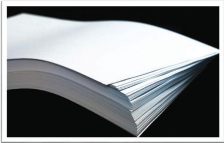
Rajah 2: Imej Kertas Permukaan Berkilat ( Glossy-Coated Paper )

Seterusnya, Rajah 2 menunjukkan kertas yang digunakan untuk mencetak peta pelancongan menggunakan kertas bersalut permukaan berkilat ( glossy-coated paper ) atau dikenali sebagai kertas seni ( art card ). Kertas permukaan berkilat mempunyai ciri-ciri yang menarik seperti permukaan yang licin dan bersinar. Warna kelihatan lebih terang dan tajam untuk mempamerkan tulisan mudah dibaca dan dilihat dengan jelas.