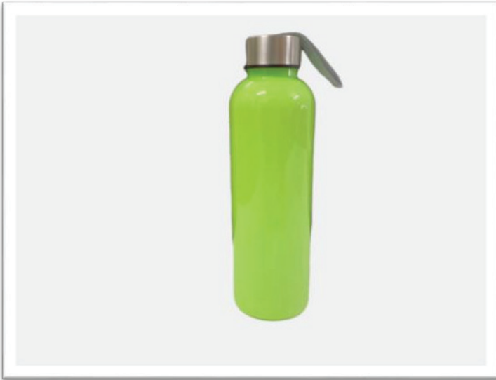
Rajah 1: Imej BPA Botol Asas ZIBMAP

bersama tahap ‘ potential of hydrogen ’ (pH) air mineral untuk mengukur keasidan dan kealkalian larutan. Logo pengesahan produk berasaskan mesra persekitaran juga dicetak bersama butiran penuh syarikat pengeluar dan pengedar produk ZIBMAP. Peta pelancongan Zoo Negara dicetak menggunakan kertas permukaan berkilat ( glossy-coated ) bagi memberi kesan cerah dan mudah dibaca selain tahan koyak dan tidak mudah calar. Peta berkenaan digulung menggunakan kayu berbentuk ‘ chopstick ’ dan dilekatkan di bahagian sisi botol bagi membolehkan peta digulung semula jika tidak digunakan.