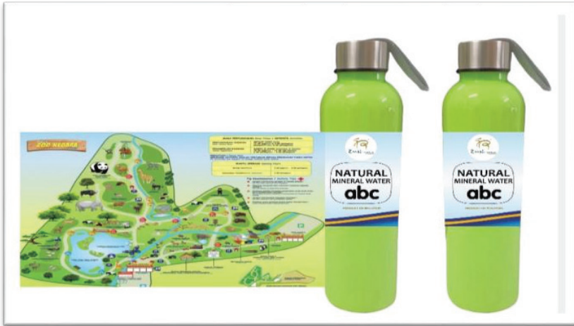
Rajah 5: Prototaip Produk Inovasi ZIBMAP

Bahan yang digunakan adalah berasaskan mesra alam sekitar dan mempunyai daya tahan pecah, kalis air dan selamat untuk digunakan. Ciri-ciri tambahan seperti pelekat gambar haiwan beserta infografik maklumat penting mengenai spesies haiwan terpilih merupakan nilai tambah kepada kanak-kanak untuk digunakan sebagai bahan pembelajaran.