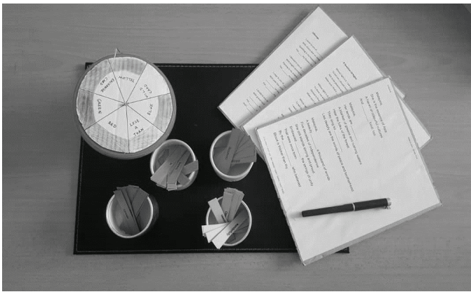
Rajah 2: POS-UP sebelum penggunaan khidmat perunding

Di peringkat ketiga, proses pembanguan POS-UP yang mana permasalahan dan objektif POS-UP telah dikenal pasti, permainan papan ini direka bentuk melalui beberapa siri uji lari. Rajah 2 menunjukkan reka bentuk awal POS-UP. Reka bentuk permainan POS-UP pada awalnya terdiri daripada sebuah roda putar, beberapa papan permainan dan juga potongan kertas yang bertulis dengan golongan kata diatasnya.