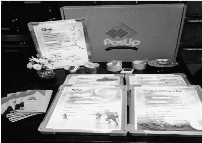
Rajah 3: POS-UP selepas menggunakan khidmat perunding

Setelah uji lari dijalankan, analisis soal selidik telah dilaksanakan menggunakan pengiraan deskriptif yang mudah. Hasil dari kaji selidik yang dibuat, penambahbaikan dilaksanakan pada reka bentuk permainan papan tersebut. Khidmat perunding telah diguna pakai untuk melaksanakan reka bentuk POS-UP mengikut idea dan hasil kaji selidik yang telah dibuat. Tujuan penggunaan khidmat perunding adalah untuk menghasilkan produk akhir yang mampu menarik minat pelajar serta boleh dikomersialkan. Rajah 3 menunjukkan hasil produk selepas khidmat pakar runding digunakan dalam pelaksanaan reka bentuk produk.