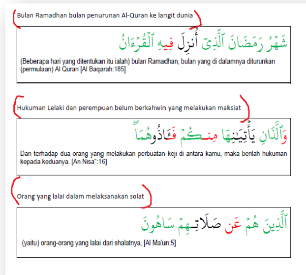
Rajah 3 : Contoh tajuk-tajuk yang disediakan mengikut ayat al-Quran yang diberikan