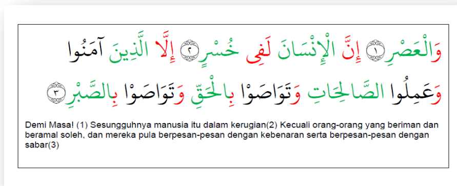
Rajah 2: Contoh penggunaan warna primer dalam pembelajaran surah al-Asr.

Pembahagian perkataan di dalam Al-Quran menggunakan tiga warna primer bagi setiap perkataan. Warna hijau mewakili Al-Isim (KN) , merah Al-Huruf (KS) dan hitam Al-Fiel (KK) . Seperti yang di dapati dalam Rajah 2 di atas. Perkataan yang diwarnakan dengan hijau itu adalah tergolong daripada kata nama seperti al-Asr, al-Insan, Khusr, Allazina, Assolihat, al-Haq dan as-Sabr . Manakala perkataan yang berwarna merah adalah perkataan yang terdiri daripada kata sendi yang pelbagai seperti Waw al-Qasm, Inna, La fi, Illa, waw al-Atf dan huruf jar bi . Selain itu perkataan yang merupakan kata kerja menggunakan warna hitam iaitu Amanu, 'Amilu dan Tawasau . Oleh itu para pelajar akan dapat membezakan dengan lebih mudah setiap jenis perkataan dan dapat mengenalpasti dengan pantas perbezaan ketiga-tiga jenis perkataan ini.