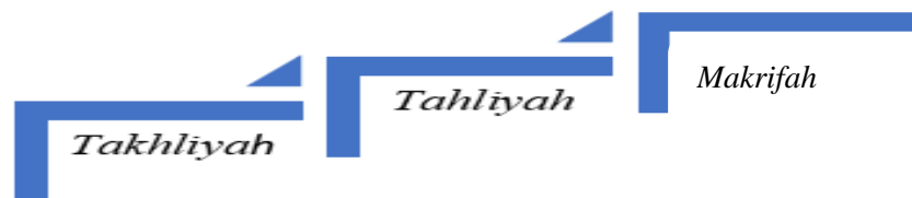
Rajah 1: Peringkat Mencapai Makrifah

Takhliyah merupakan proses pembersihan diri dengan meninggalkan segala dosa dan sifat tercela yang boleh merosakkan kejernihan hati. Tahliyah pula bermaksud menghias diri dengan ketaatan kepada Allah dari sudut kepercayaan dan amalan (al-Jurjani, 2003). Setiap Muslim dikehendaki memulakan perjalanan spiritualnya melalui peringkat takhliyah dengan meninggalkan segala larangan Allah terlebih dahulu. Setelah itu, barulah disusuli pula dengan peringkat tahliyah melalui perlaksanaan segala suruhanNya (al-Tusi, 2007). Peringkat-peringkat tersebut dapat dilihat dalam rajah 1 di bawah: