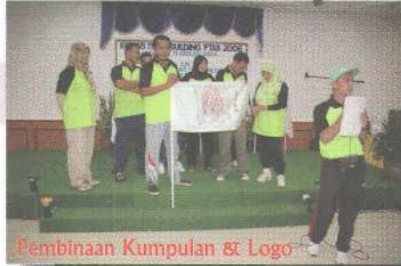
Pembinaan Kumpulan & Logo