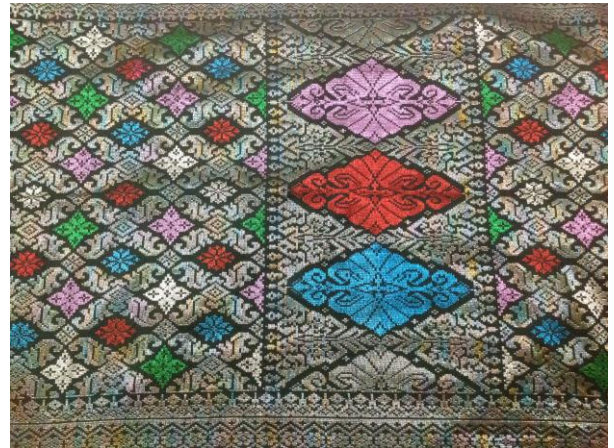
Gambar 5: Songket tempatan yang motifnya ditiru oleh songket luar