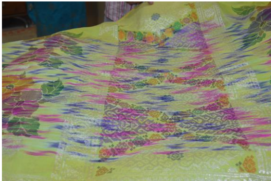
(Koleksi Wan Manang Songket)

Kain Songket Corak Penuh bermotifkan bunga dan menggunakan gabungan benang metalik yang berwarna-warna.