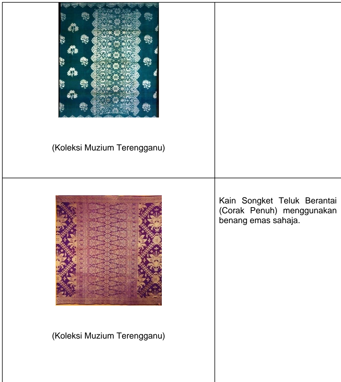
Jadual 2: Penghasilan Songket di era tahun 2000 hingga kini