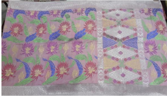
(Koleksi Wan Manang Songket)

Kain Songket Corak Penuh bermotifkan bunga dan menggunakan gabungan benang metalik yang berwarna-warna.