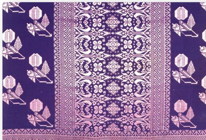
Gambar 3: Songket Sarung