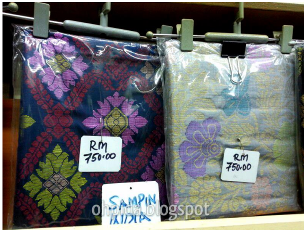
Gambar 4: Songket India yang kini berada di pasaran