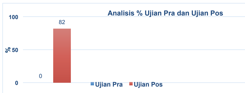
Rajah 2 Analisis Perbandingan % Dapat Menjawab/Tidak Dapat Menjawab Soalan Ujian Pra dan Pos