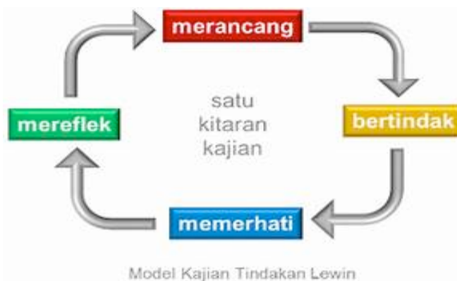
Rajah 1 Model Kajian Tindakan Lewin

Selain itu, model penyelidikan tindakan yang telah dipilih oleh pengkaji untuk dijadikan sebagai rujukan dalam kajian ini adalah Model Kurt Lewin (1948). Kurt Lewin merupakan pelopor kepada kajian tindakan (action research). Model beliau yang dikenali sebagai Kurt Lewin's Action Research Spiral bertujuan menunjukkan penambahbaikan yang berterusan dalam pembelajaran mengenai apa yang telah dikaji. Model Kurt Lewin ini biasanya digunakan apabila masalah atau isu kajian telah dikenal pasti oleh pengkaji, iaitu pelajar tidak dapat menumpukan perhatian terhadap proses Pengajaran dan Pembelajaran. Dalam model ini, Lewin telah menjelaskan bahawa dalam satu penyelidikan tindakan terdapat satu kitaran yang terdiri daripada empat peringkat iaitu refleksi, merancang, bertindak dan memerhati dan seterusnya kembali kepada refleksi semula seperti dalam gambarajah 1 di bawah: