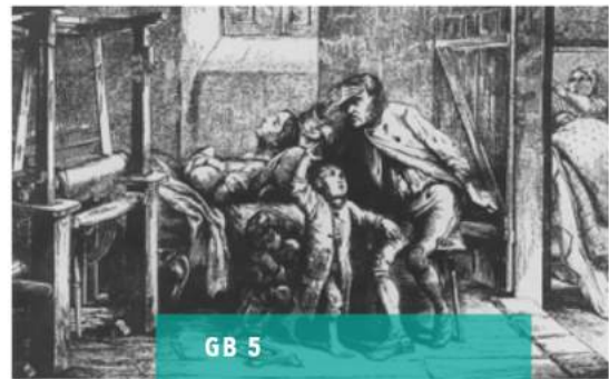
GB 5 Karya Seniman Heinrich Heine berjudul The Silesian Weavers (Kitchen, 2012: 40)

Penggunaan kayu sebagai material mentah dan sumber energi di abad 18 banyak digunakan di Jerman (Warde, 2006: 6). Hal ini berbeda dengan material dan gaya bangunan gereja-gereja di Jerman pada abad tersebut. Begitu pula dengan penggambaran kehidupan kelas sosial ekonomi masyarakat Jerman pada abad 17 sampai dengan 19 sebagai berikut :