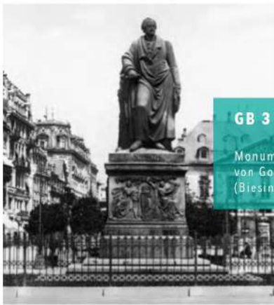
GB 3 Monumen Johann Wolfgang von Goethe di Frankfurt

(1729-81), Friedrich von Schiller (1759-1805), dan Johann Wolfgang von Goethe (1749-1852). Goethe selama menjadi mahasiswa Universitas Strassburg menulis beberapa karya seperti Prometheus (1773), Götz von Berlichingen (1773), The Sorrows of Young Werther ( Die Leiden des jungen Werthers ) (1774), Faust trilogy (1773, 1806, dan 1832). Berikut monumen Johann Wolfgang von Goethe di Frankfurt: