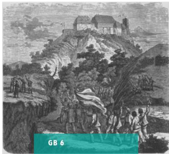
GB 6 Burschenschaften dalam Wartburg Festival Tahun 1818 (Kitchen, 2012: 49)

Beberapa contoh bangunan Barok adalah Versailles (dekat Paris) - Louis Le Vau, Gereja Theatinerkirche (Munich) - Zuccalli, Istana Belvedere (Wina) - John. Lukas v. Hildebrandt, Istana Sanssouci (Potsdam) - Georg von Knobelsdorff, Residen (Würzburg) - Balthasar Neumann/Giovanni Tiepolo als Maler.