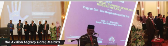
The Avillion Legacy Hotel, Melaka