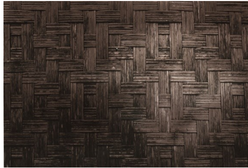
1.2 © 2015. Mohammad Firdaus Azman. Fotografi Abstrak Seni Anyaman Dinding Rumah.

hijau” adalah satu “moment”, apatah lagi ia adalah satu ramuan yang tidak asing lagi dalam mengadaptasi dan mengubah setiap subjek “nature” ke dalam bentuk visual. Penterjemahan setiap visual adalah intipati luahan individu yang mempunyai idea yang tersendiri dalam pembikinan karya berbentuk fotografi. Subjek di dalam visual ini adalah satu anyaman dinding sebuah pondok di dalam kawasan Hutan Royal Belum, yang merupakan salah satu daripada hutan hujan tertua di dunia, sejak lebih 130 juta tahun (Wonderful Malaysia, 2007-2017) yang terletak di negeri Perak, Malaysia.