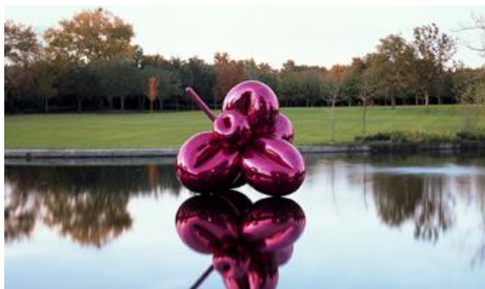
Ballon Flower (Magenta), 1995-2000

dan lain-lain, tetapi pada ketika ini kebanyakan seniman sudah mula menggunakan warna-warna ini di dalam penghasilan karya. Contohnya karya Jeff Koons yang bertajuk Ballon Flower (Magenta) , (1995-2000). Beliau adalah seorang artis kontemporari yang paling berjaya pada hari ini di mana beliau mengabadikan dirinya di dalam karya melalui imej dengan pendekatan karya yang menggunakan warna kontemporari. Jeff Koons menterjemah karya beliau dengan penggunaan subjek mainan dan hadiah melalui arca dan catan dengan warna yang brilliant dan saiz yang berskala besar.