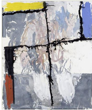
Black (Remix) oil on canvas, 2007

“...and if you reconverted the painting today, the blue skin of the negative would become flesh-colored. Of course you could say that this is mere gimmickly- but for me, this work is very serious, even over period of months or years.”