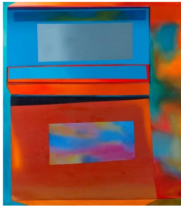
Wanda, 1969, Oil on Canvas, 152cm x 135cm

warna digunakan sebagai cara menyampaikan sifat permukaan, sifat pigmen visual dan ruang bergambar yang dinyatakan dengan kesan ilusi minima.