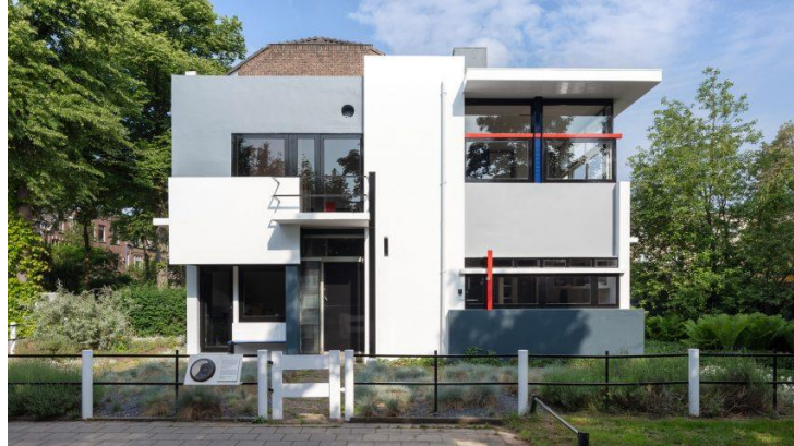
Rietveld Schroder House, 1924

Unsur-unsur warna dan elemen di dalam karya Piet Mondrian juga digunakan dalam seni bina. Sebagai contohnya arkitek Gerrit Rietveld telah mengubah perspektif pergerakan seni bina.