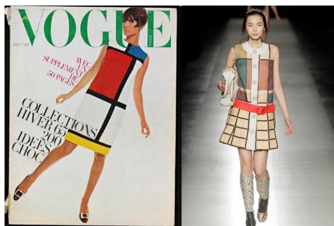
Majalah Vogue, 1965

Karya beliau telah berubah dari masa ke semasa sehingga beliau menghasilkan karya yang sangat minimalis dengan penggunaan warna-warna prima contohnya karya Composition II Red, Blue and Yellow pada tahun 1930. Karya beliau telah memberi kesan terhadap budaya dan kita dapat melihat bagaimana pengaruh karyanya berpanjangan yang mengubah gaya seni, muzik, seni bina dan fesyen hingga kini. Ini dapat dilihat dengan jelas melalui majalah Vogue 1965 yang mana hasil rekaan pakai pada majalah tersebut telah menggunakan hasil karya Piet Mondrian.