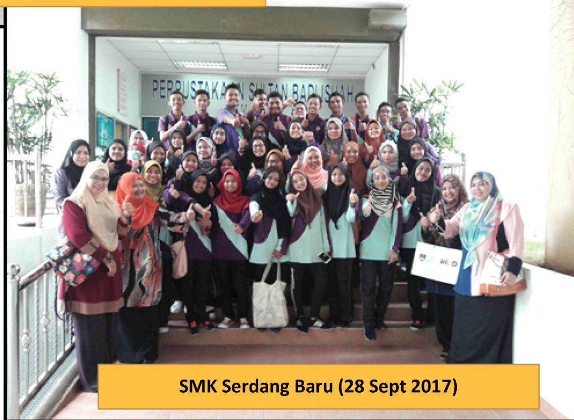
SMK Serdang Baru (28 Sept 2017)