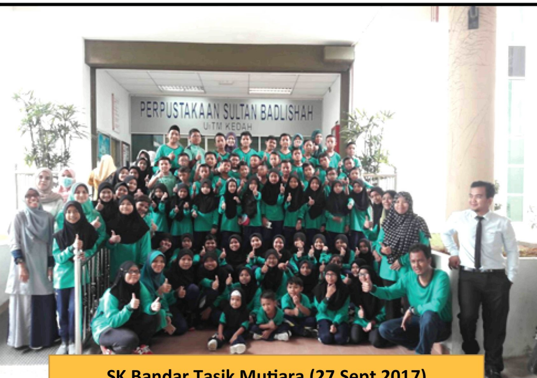
SK Bandar Tasik Mutiara (27 Sept 2017)