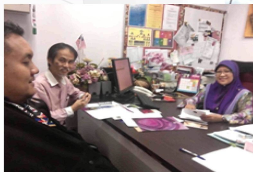
Juri Pertandingan Fotografi Kemerdekaan Flora Fauna.