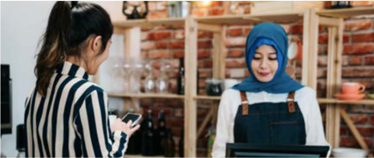
Rajah 2: Pendigitalan perniagaan adalah keperluan untuk meneruskan perniagaan.

Impak COVID-19 memperlihatkan usaha kerajaan selama ini ke arah Revolusi Perindustrian Keempat (IR 4.0) membabitkan teknologi automasi, tepat dan bukan sia-sia. Ini membuka mata masyarakat mengenai peranan sains dan teknologi. Pada masa hadapan, masyarakat akan lebih menghargai produk berelemen sains dan teknologi. Harus diakui negara ini kekurangan usahawan teknoprenur dalam menghasilkan produk berasaskan sains dan teknologi. Ini merupakan peluang keusahawanan yang perlu direbut.