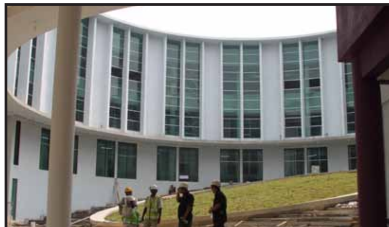
Bangunan baru perpustakaan