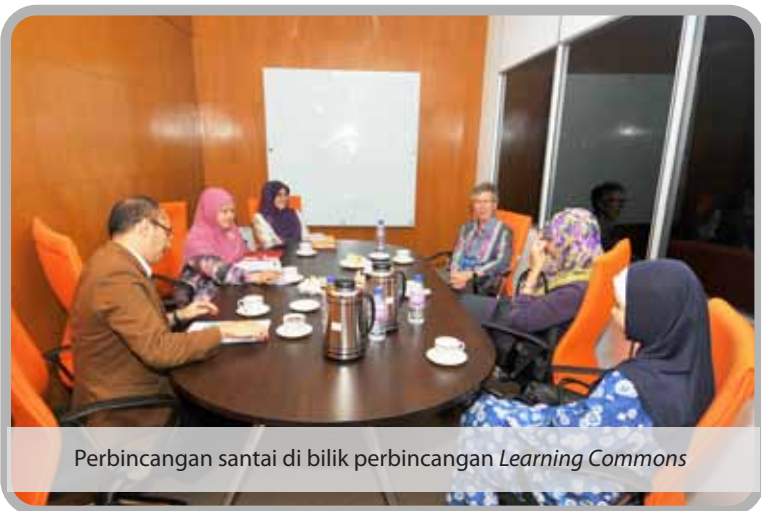
Perbincangan santai di bilik perbincangan Learning Commons