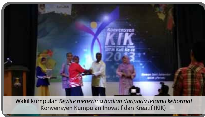
Wakil kumpulan Keylite menerima hadiah daripada tetamu kehormat Konvensyen Kumpulan Inovatif dan Kreatif (KIK)