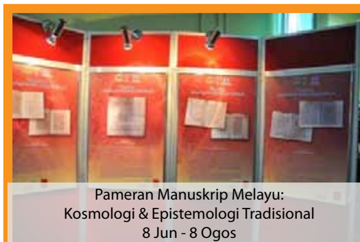
Pameran Manuskrip Melayu: Kosmologi & Epistemologi Tradisional 8 Jun - 8 Ogos