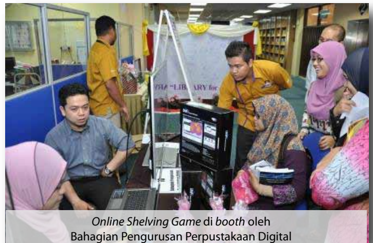
Online Shelving Game di booth oleh Bahagian Pengurusan Perpustakaan Digital

Turut menjadi kebanggaan kepada PTAR, UiTM adalah pengumuman daripada Emerald Publishing yang memaklumkan bahawa PTAR, UiTM kekal diiktiraf sebagai penerima anugerah utama di dunia yang menggunakan pangkalan data Emerald (Highest Download) buat kali ketujuh berturut-turut semenjak tahun 2007 lagi.