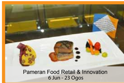
Pameran Food Retail & Innovation 6 Jun - 23 Ogos

Aktiviti pameran yang dijalankan di PTAR meliputi 2 kategori iaitu Pameran Dalaman Bertema dan Pameran Usahasama. Setiap pameran yang dijalankan akan dipamerkan di Sudut Pameran (Aras 2, PTAR Utama) atau di Galeri PTAR mengikut kesesuaian jenis, saiz dan kuantiti bahan yang dipamerkan. Pameran Dalaman Bertema disediakan oleh pihak Bahagian Perkhidmatan Rujukan, PTAR melalui proses pencarian maklumat, pempakejan maklumat dan seterusnya mempamerkan maklumat tersebut sebagai bahan pameran. Pameran Usahasama pula adalah satu jalinan kerjasama dan keserakanan antara pihak PTAR dengan fakulti/ jabatan dalam UiTM atau badan korporat/ badan bukan kerajaan/ syarikat bagi tujuan perkongsian maklumat serta penyampaian info-info terkini berkaitan organisasi tersebut dan isu-isu semasa yang berkaitan.