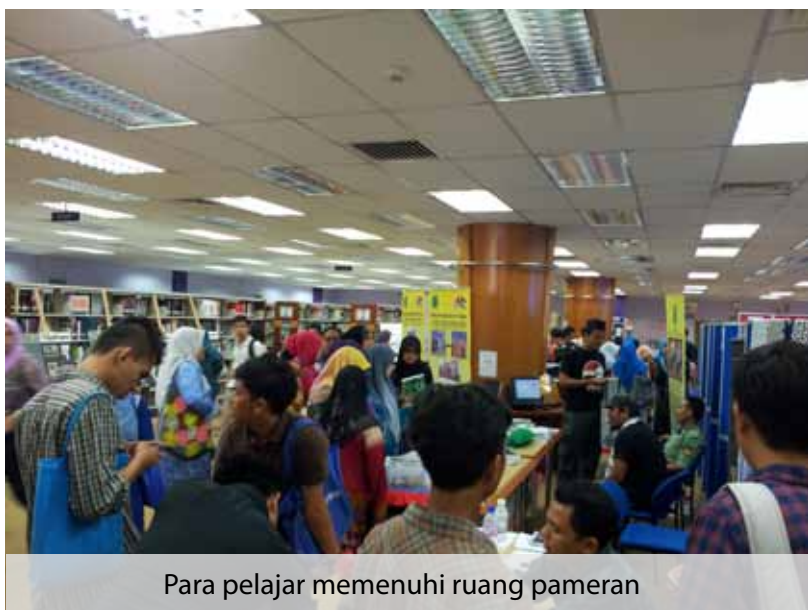
Para pelajar memenuhi ruang pameran