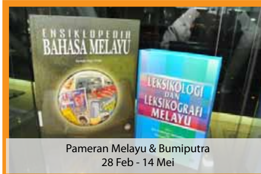
Pameran Melayu & Bumiputra 28 Feb - 14 Mei