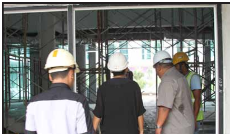
Ruang lobi perpustakaan