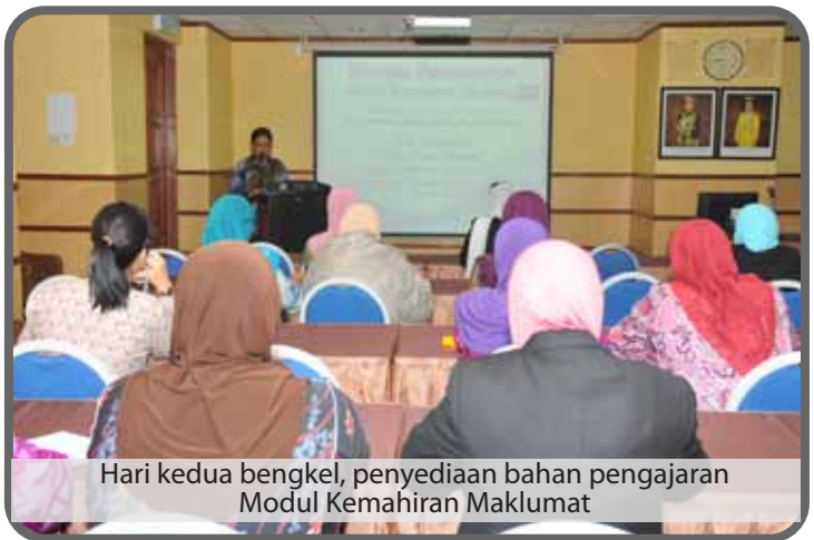
Hari kedua bengkel, penyediaan bahan pengajaran Modul Kemahiran Maklumat

mengikut kategori pelanggan perpustakaan berdasarkan kepada keperluan maklumat dan tahap pendidikan.