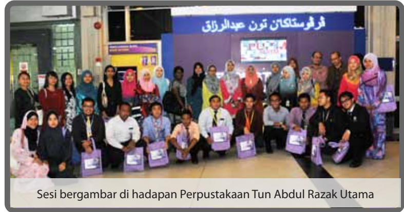
Sesi bergambar di hadapan Perpustakaan Tun Abdul Razak Utama

Sebaik sahaja rombongan lawatan ini telah berada di bilik seminar PTAR, mereka telah didedahkan kepada sejarah, perkembangan, perkhidmatan dan kemudahan yang terdapat di PTAR. Selain daripada