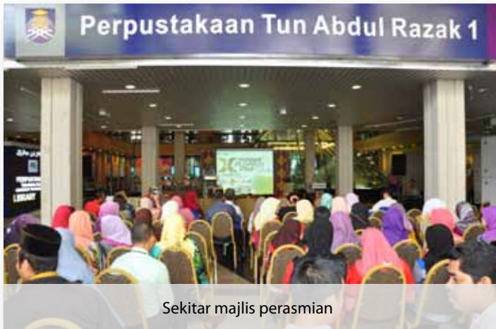
Sekitar majlis perasmian

“UiTM kekal diiktiraf sebagai penerima anugerah utama di dunia yang menggunakan pangkalan data Emerald (Highest Download) buat kali ketujuh berturut-turut semenjak tahun 2007.”