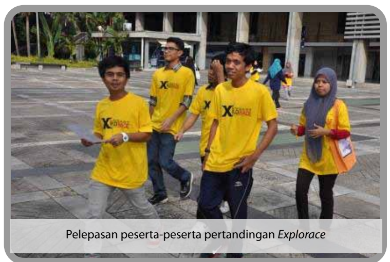
Pelepasan peserta-peserta pertandingan Explorace

Imbas QR Code ini untuk album penuh atau layari FB Ketua Pustakawan UiTM https://www.facebook.com/KetuaPustakawanUitm