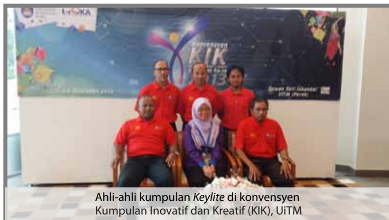
Ahli-ahli kumpulan Keylite di konvensyen Kumpulan Inovatif dan Kreatif (KIK), UiTM