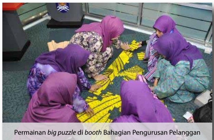
Permainan big puzzle di booth Bahagian Pengurusan Pelanggan