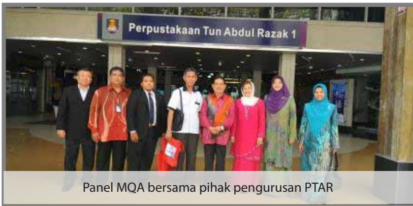
Panel MQA bersama pihak pengurusan PTAR

oleh Aznur Umiza Abu Kassim / Bahagian Jaminan Kualiti