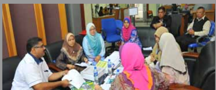
Sesi soal jawab audit bersama pengurusan PTAR dan Perpustakaan Sains dan Teknologi