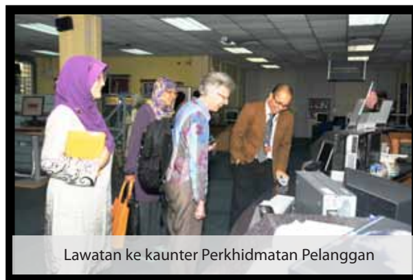
Lawatan ke kaunter Perkhidmatan Pelanggan