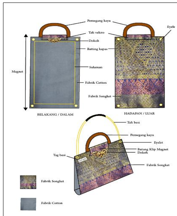
Rajah 2 Beg Telekung yang boleh diterbalikkan dan boleh dijadikan sejadah serta boleh digayakan.