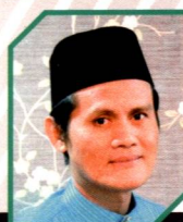
Abdul Khalid Karim PHOTOGRAPHER