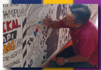
Mural, Makeover, Merdeka! PTAR Jenaka - muka 7