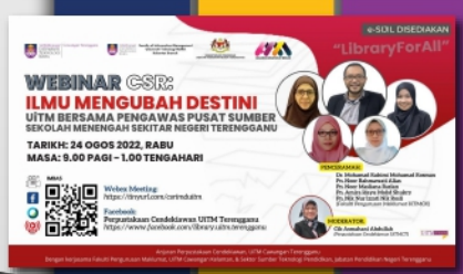
Webinar CSR: Ilmu Mengubah Destini Bersama Pengawas Pusat Sumber Sekolah Sekitar Negeri Terengganu PTAR Dungun- muka 20