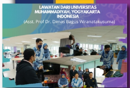
Lawatan Dari Universitas Muhammadiyah, Yogyakarta, Indonesia PTAR Kampus Bandaraya - muka 12