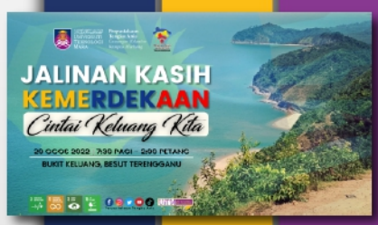
Program Jalinan Kasih Kemerdekaan - Cintai Keluang Kita PTAR Machang - muka 18