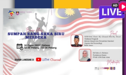
Live@PTAR: Program Sambutan Bulan Kemerdekaan Segmen Bicara Khas; Sumpah Sang Saka Biru Merdeka PTAR Shah Alam - muka 4