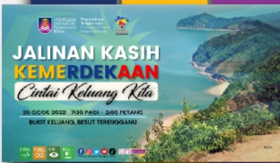
Program Jalinan Kasih Kemerdekaan - Cintai Keluang Kita PTAR Machang - muka 18