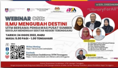
Webinar CSR: Ilmu Mengubah Destini Bersama Pengawas Pusat Sumber Sekolah Sekitar Negeri Terengganu PTAR Dungun- muka 20