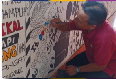
Mural, Makeover, Merdeka! PTAR Jenaka - muka 7