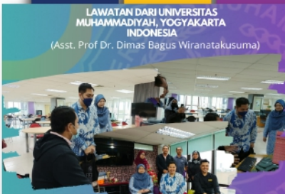
Lawatan Dari Universitas Muhammadiyah, Yogyakarta, Indonesia PTAR Kampus Bandaraya - muka 12