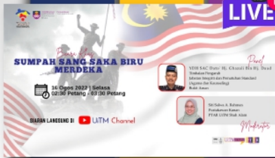
Live@PTAR: Program Sambutan Bulan Kemerdekaan Segmen Bicara Khas; Sumpah Sang Saka Biru Merdeka PTAR Shah Alam - muka 4