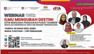
Webinar CSR: Ilmu Mengubah Destini Bersama Pengawas Pusat Sumber Sekolah Sekitar Negeri Terengganu PTAR Dungun- muka 20