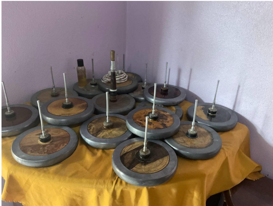
Gambar 5. Koleksi Gasing Uri Abe Nor