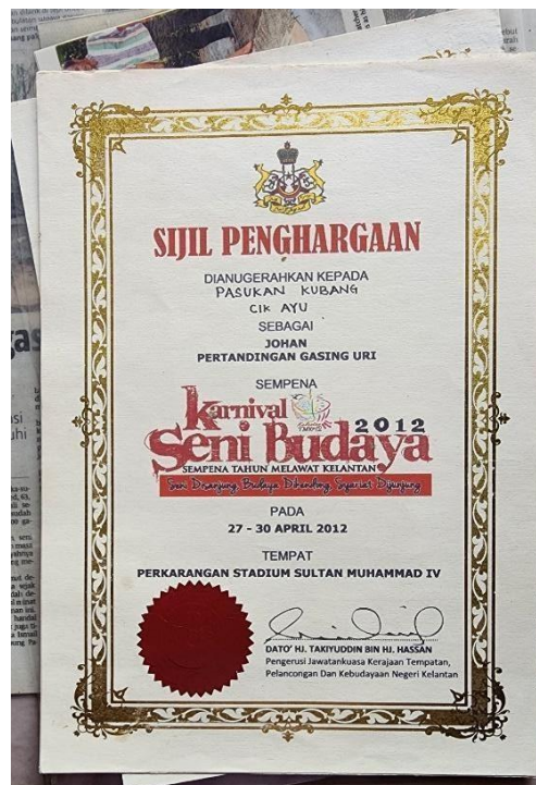
Gambar 14. Sijil penghargaan