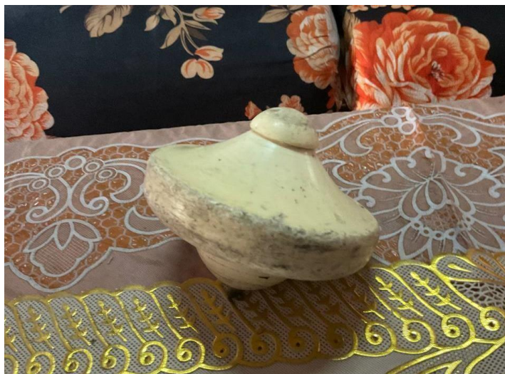
Gambar 3. Gasing pangkah