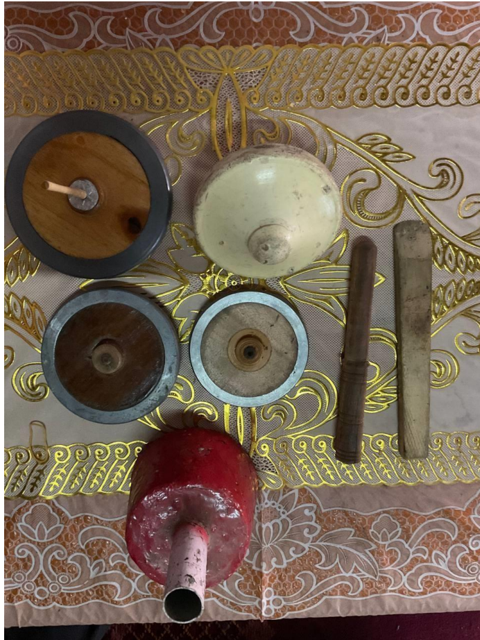
Gambar 2. Peralatan bagi permainan gasing