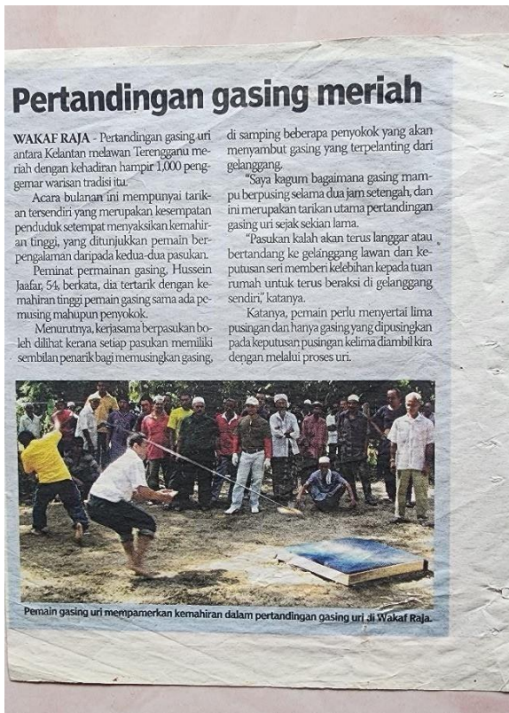
Gambar 7. Surat khabar berkaitan Abe Nor