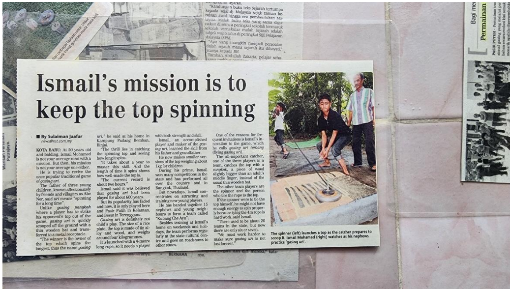
Gambar 8. Surat khabar berkaitan Abe Nor