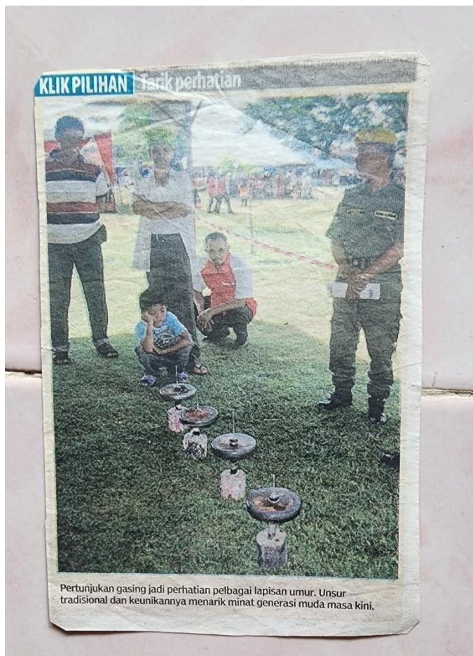
Gambar 9. Surat khabar berkaitan Abe Nor