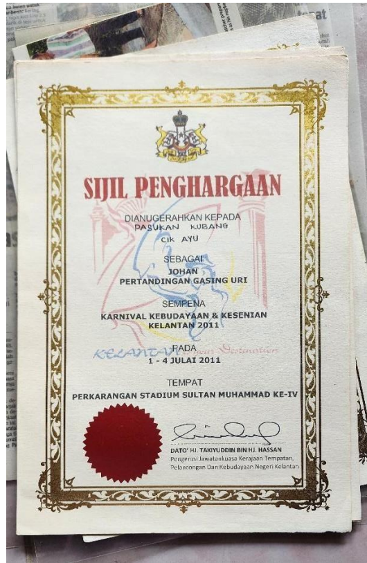
Gambar 11. Sijil penghargaan