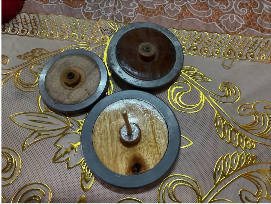
Gambar 4. Gasing Uri