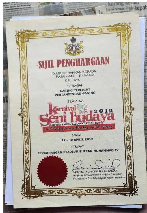
Gambar 12. Sijil penghargaan