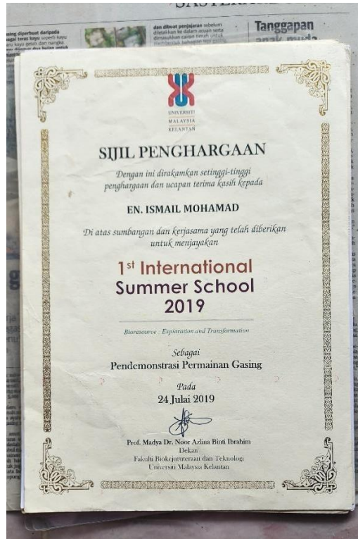
Gambar 13. Sijil penghargaan