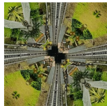
Another Dimension-Bukit Bendera Series

Oleh itu, jika dieksploitasi dengan betul, muncul corak-corak yang luar jangka yang cantik dan unik. Dengan adanya perisian-perisian begini, karyawan pada masa kini tidak akan hanya tertumpu kepada medium pensil, cat warna atau medium lain, tetapi lebih meluas kepada medium digital.