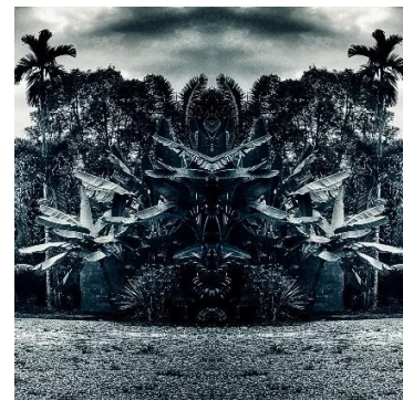
Unexpected – Kamsung Series