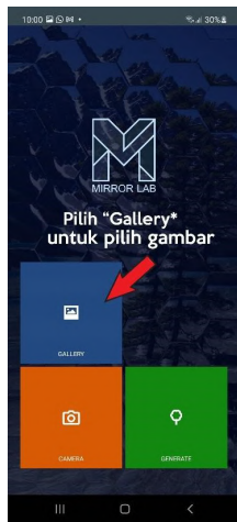
Langkah 2 : Klik "Gallery" dan pilih gambar