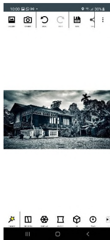
Langkah 3 : Paparan aplikasi, Pengguna boleh klik "Preset"