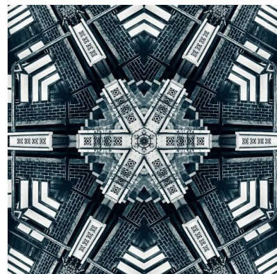
Gambar setelah dilakukan eksploitasi