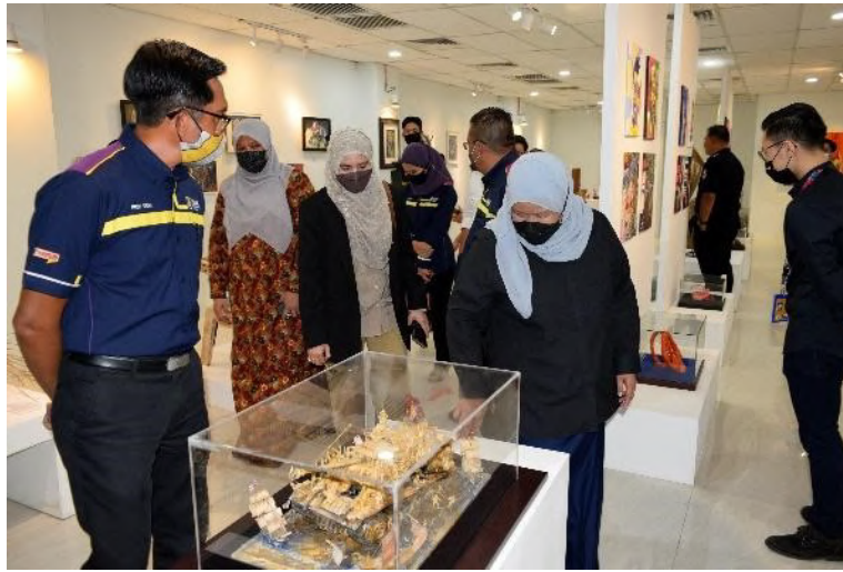
Sesi lawatan ke Galeri Seni Merbok

Selepas selesai lawatan di Galeri Seni Merbok, Naib Canselor diiring oleh Rektor untuk melawat produk Batik Merbok yang merupakan salah satu produk UiTM Cawangan Kedah yang manjana pendapatan universiti. Beliau diberi taklimat ringkas berkaitan keistimewaan motif batik Merbok yang dihasilkan dari flora dan fauna yang terdapat di kawasan Merbok. Motif ini cuba diketengahkan supaya mendapat perhatian peminat-peminat batik di seluruh dunia. Hasil kunjungan ini, beliau telah membuat tempahan 2 persalinan batik untuk dijadikan koleksi beliau.