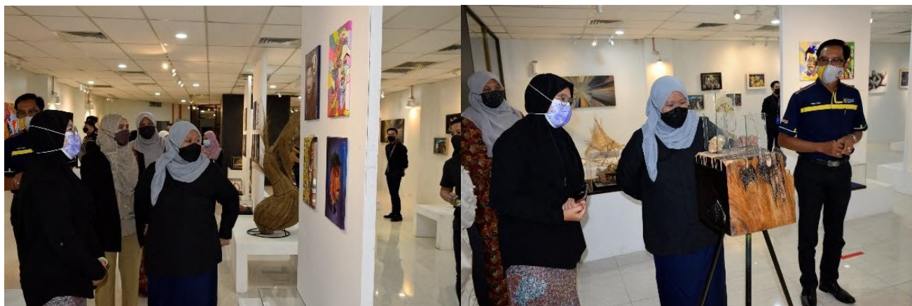
Sesi lawatan ke Galeri Seni Merbok