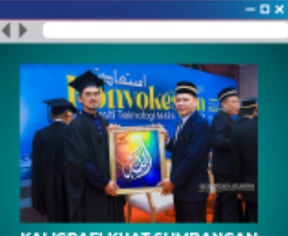
PENGASAS SHAH TUMIN ART GALLERY DITEMPATKAN DI