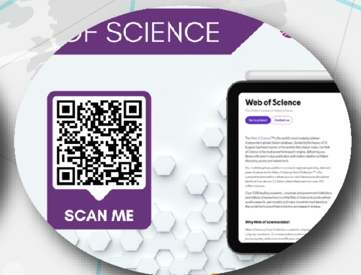
Web of Science