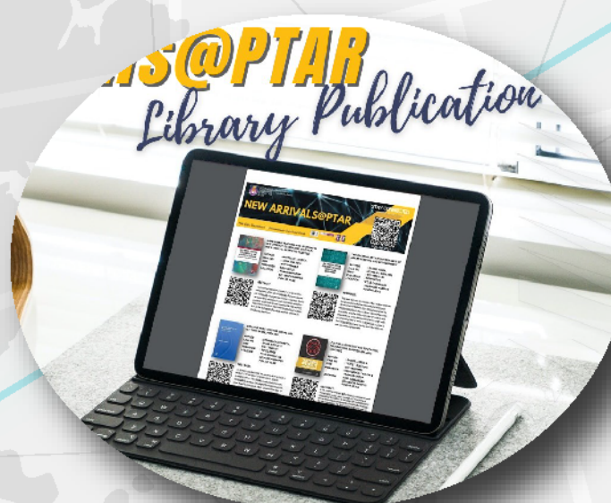
New Arrivals@PTAR Library Publication