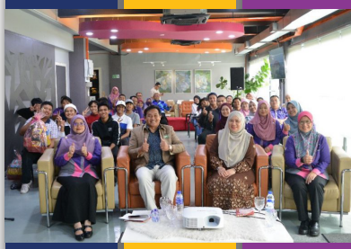
Hari Terbuka PTAR UiTM Cawangan Melaka PTAR Kampus Alor Gajah - muka 11