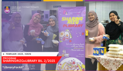
Program SharingRizq@Library UiTM Cawangan Terengganu PTA Kampus Dungun - muka 18