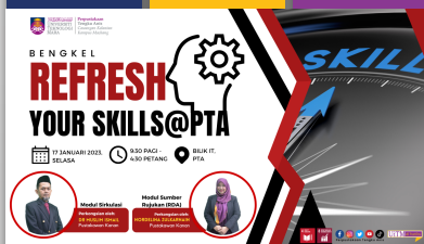
Bengkel "Refresh Your Skills@PTA" PTAR Kampus Machang - muka 26