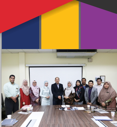
Kunjungan Hormat PTAR ke atas Penolong Naib Canselor (Keusahawanan) PTAR Shah Alam - muka 4