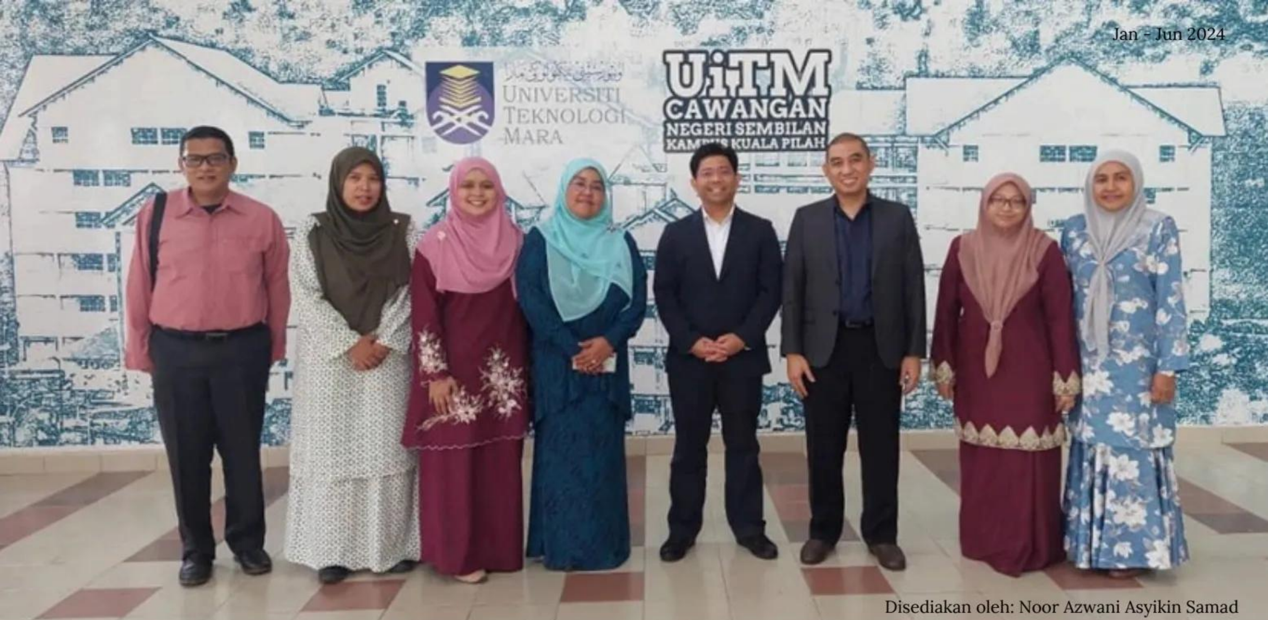
Disediakan oleh: Noor Azwani Asyikin Samad