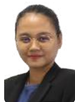
COMMELIE ELM LIE RISIP