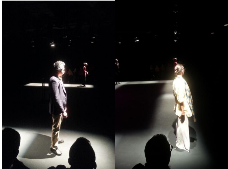
Gambar 3. Tanda Meluntur Realiti melalui Persembahan Teater Kompilasi Mat Deris Kola Perlih & Lembu arahan Namron.