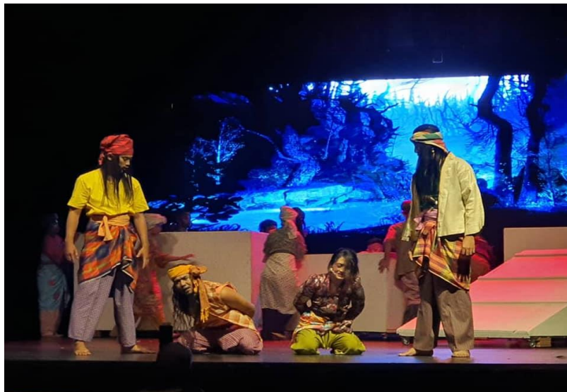
Gambar 2. Tanda Penyamaran dan Pemalsuan melalui Persembahan Teater Semerah Padi arahan Nor Shuradi

Tanda Penyamaran dan Pemalsuan Realiti adalah merujuk kepada tanda yang tidak tulen, asli dan murni. Sebaliknya tanda yang dihasilkan bersifat tiruan dan berpura-pura (pretending) melukis kenyataan, yakni konsep penanda yang mengurangi (reduction) rujukan realiti. Pada dasarnya, Tanda Penyamaran dan Pemalsuan Realiti terhasil dari sumber realiti (reality of sign). Sumber rujukan realiti adalah material yang digunakan semula oleh pengkarya untuk menghasilkan tanda-tanda baharu di dalam sistem tanda teater.