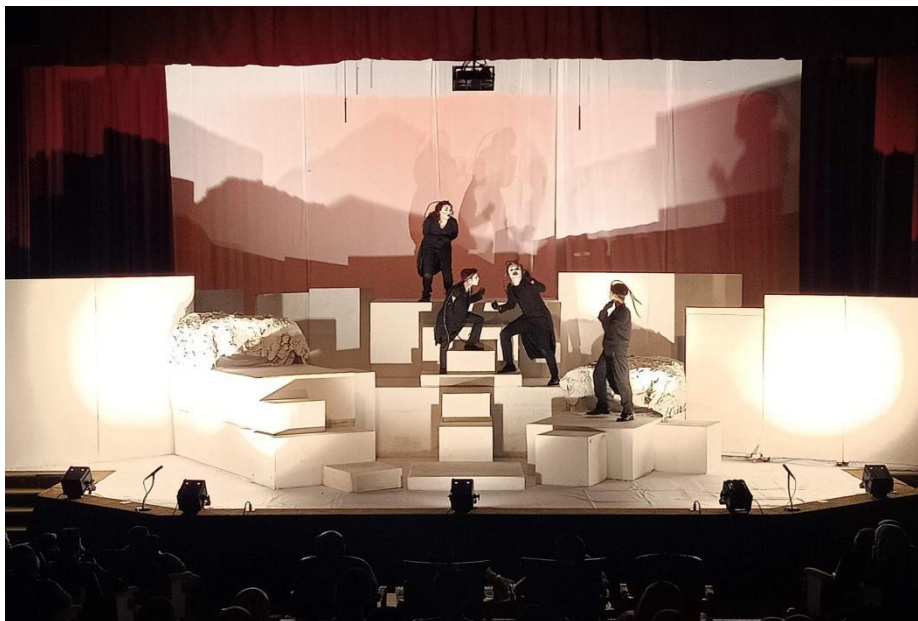
Gambar 4. Tanda Ekstrem Realiti melalui Persembahan Teater Lipas arahan Nor Shuradi.

Tanda ekstrem realiti adalah merujuk kepada tanda yang menampilkan penandaan yang ekstrem (hyper signification), melampaui representasi realiti dan malahan tanda yang tiada langsung berkaitan dengan dunia kehidupan nyata. Secara dasarnya, tanda ekstrem realiti ditandai sebagai penanda yang melebihi atau melampaui sesuatu fakta, perkara atau objek nyata yang disisipkan pada sistem tanda teater. Perihal ini menunjukkan tanda yang dibangunkan pada sistem tanda teater meliputi sistem tanda pelakon, sistem tanda visual (set pentas, efek cahaya pentas, busana, tatarias, props, multimedia,) dan sistem tanda bunyi adalah merupakan kondisi, simbol atau fakta baharu yang melampaui batas tanda benar sehingga makna peristiwa menjadi sangat ekstrem.