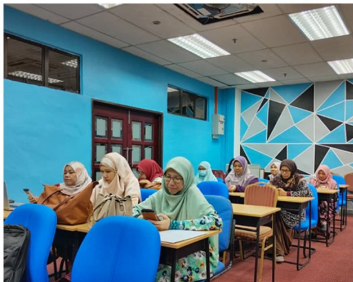
11) Peserta Bengkel Perancangan Strategik