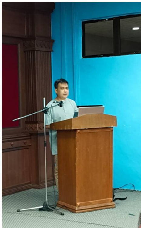
10) Ulasan dan Penerangan dari Koordinator ICAN