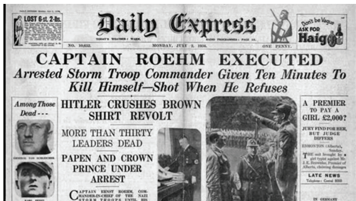
Daily Express: Keratan berita pada tahun 1934 oleh Daily Express

Ernst Rohm: Inilah lelaki yang menjadi ketua SA, sahabat baik dan pendukung Hitler namun turut dibunuh dalam operasi ini. Dialah punca utama operasi ini terpaksa berlaku.