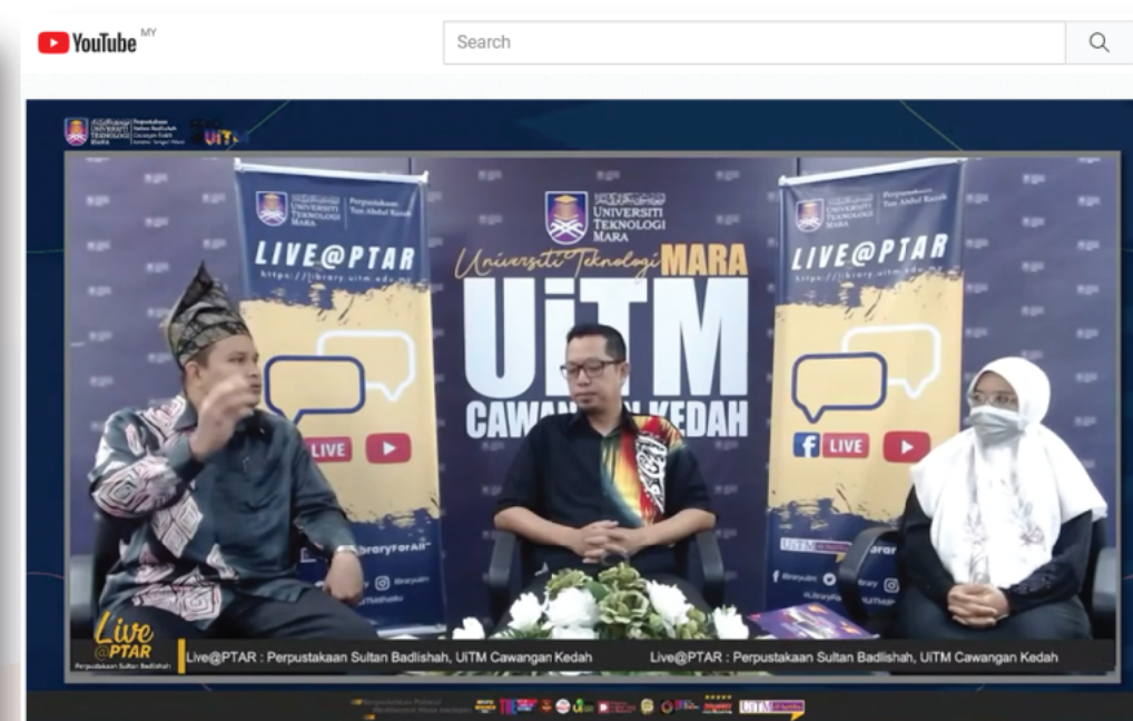
Live@PTAR * Menelusuri Kegemilangan Ulama Di Dalam Perjuangan Jihad Nusantara *