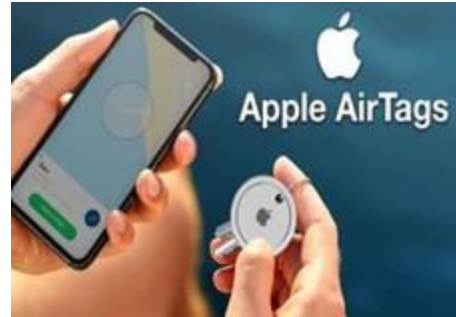
Gambar 3: Teknologi pengesanan

Pemasangan Air-Tag atau tracker pada ahli keluarga serta bagasi ketika melancong dilihat dapat meningkatkan risiko keselamatan dan mengurangkan risiko kehilangan. Dengan teknologi ini, pengembara dapat memantau dan mengesan keberadaan barang-barang yang dipasangkan teknologi ini dengan selamat serta mengawal status lokasi terkini bagasi ketika melancong.