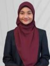
HAIB YANG DI-PERTUA