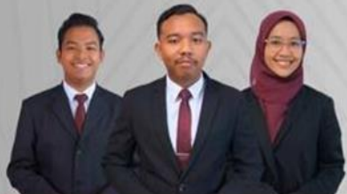
EXCO EKONOMI & KEUSAHAWANAN