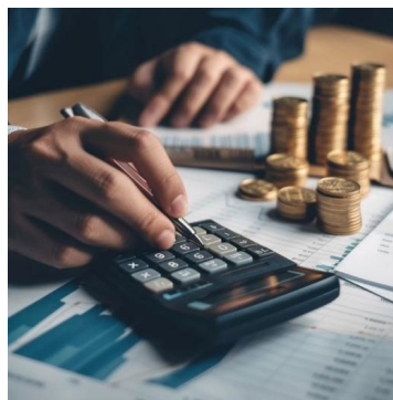
Gambar 1: Perancangan perbelanjaan adalah penting.

Menabung adalah salah satu cara paling berkesan untuk mengatasi masalah ini. Dengan disiplin yang betul, seseorang dapat menggunakan peningkatan gaji mereka untuk membina tabungan kecemasan, melabur untuk masa depan, dan mencapai matlamat kewangan yang lebih besar.