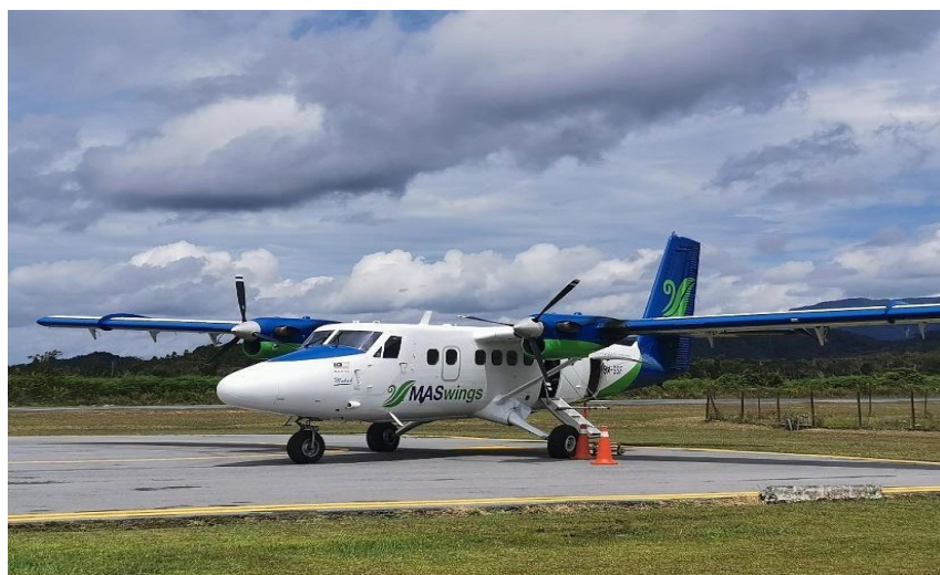
Gambar 3: Twin Otter DHC-6 pengangkutan utama ke Tanah Tinggi Bario

Kebanyakan masyarakat setempat di sini merupakan warga emas kerana ramai yang telah berhijrah ke kawasan bandar berhampiran dan hanya akan kembali ke Bario pada musim cuti dan pesta tempatan. Oleh yang demikian, pembangunan yang melibatkan pencerobohan ke atas alam sekitar, termasuk flora dan fauna adalah sangat minima dan terkawal.