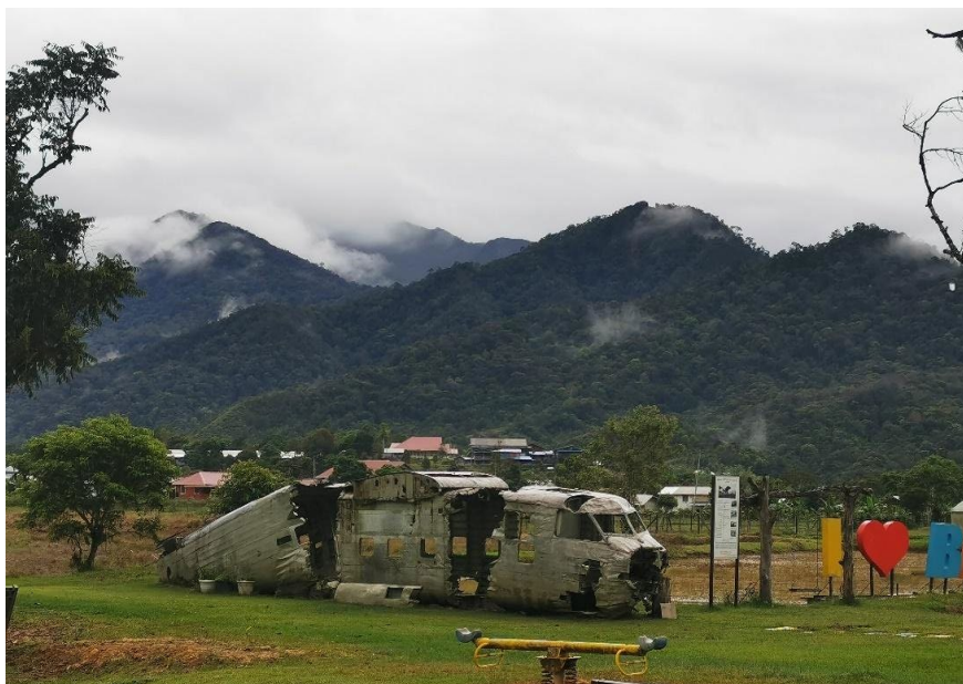
Gambar 2: Bangkai pesawat British 1964, salah satu tarikan di Bario

di Bario besar, namun terdapat cabaran yang perlu diatasi seperti infrastruktur yang terhad dan pemeliharaan alam sekitar. Dengan pengurusan yang bijak dan kesedaran akan kelestarian alam, Bario dapat terus membangunkan industri pelancongan secara mampan.