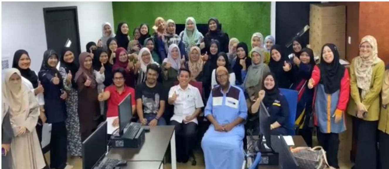
Gambar 1: Program DiME 2024 Siri Pertama di UiTM Kelantan Kampus Kota Bharu

Usaha pembasmian kemiskinan tegar adalah antara agenda utama kerajaan yang membabitkan usaha pelbagai kementerian dan agensi sekali gus memastikan kesejahteraan serta kemakmuran negara dapat dinikmati oleh semua pihak tanpa ada yang tercicir. Terkini, dalam menghapuskan miskin tegar, kerajaan memberi tumpuan kepada beberapa negeri utama seperti Sabah, Kelantan, Sarawak dan Kedah. Kerajaan turut memperuntukkan sejumlah besar dana bagi melaksanakan program menangani kemiskinan di bawah pelbagai kementerian dan agensi, antaranya program keusahawanan, modal insan, dan program peningkatan pendapatan lain untuk ketua isi rumah (KIR) miskin tegar. Di negeri Kelantan, inisiatif penghapusan miskin tegar dijalankan melalui ICU, JPM. Melalui geran penyelidikan usahasama antara pihak ICU