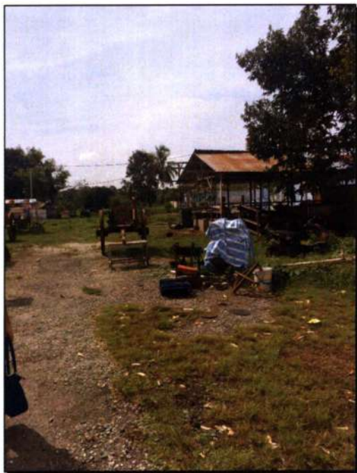
Kawasan bengkel pembuatan kereta lembu