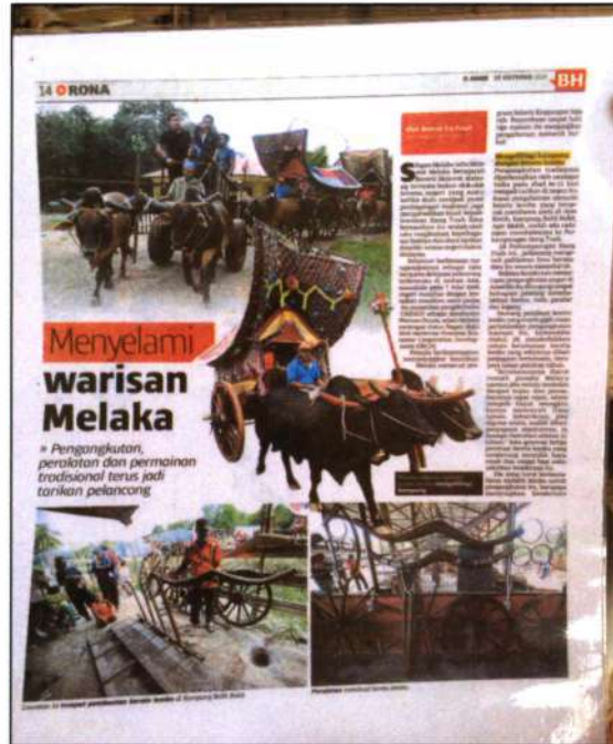
Keratan akhbar Berita Harian