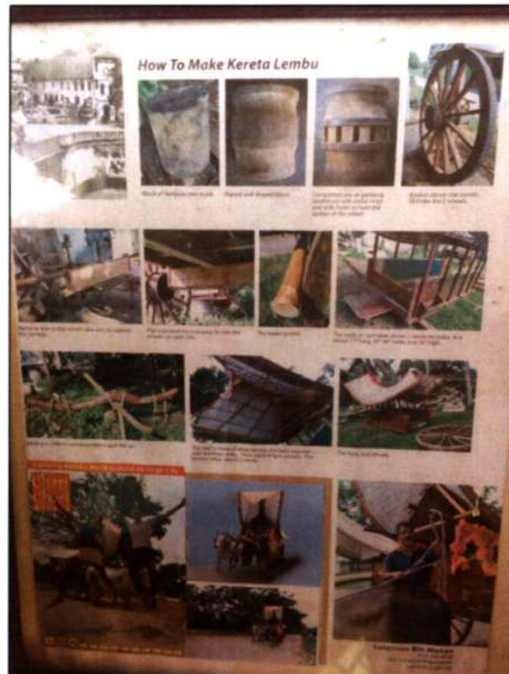
Teknik pembuatan dalam majalah Chari- Chari