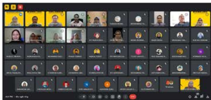
Gambar 3 : Para Peserta Webinar Eksklusif Zakat Pendapatan yang sempat bergambar

Isu ini mula mendapat perhatian Kerajaan Malaysia apabila Menteri Kewangan dalam ucapannya bertarikh 24 Mac 1990 di majlis pelancaran Buku Pengiraan Zakat di Kementerian Kewangan memaklumkan, berdasarkan statistik tahun 1988, terdapat sebahagian besar daripada 7.6 juta mereka yang bekerja dan memperolehi gaji serta pendapatan adalah mereka yang beragama Islam. Sekiranya gaji ini dikeluarkan zakat, mereka adalah pembayar zakat terbesar di Malaysia. Bengkel Taksiran Zakat di Ayer Keroh pada 20-22 Ogos 1990 pula telah mengeluarkan resolusi "Majlis Fatwa Kebangsaan patut mengeluarkan fatwa bahawa gaji dan pendapatan professional diwajibkan zakat".