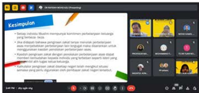
Gambar 2 : Penceramah Dr Anwar Muttaqin sedang menyampaikan modul

diwajibkan zakat kerana ia termasuk dalam al-mal al-mustafad (harta perolehan) hasil dari gaji, upah atau bayaran kepada pekerjaan yang dilakukan oleh seseorang.