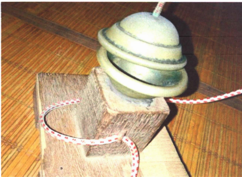
Gambar 6 : Cing