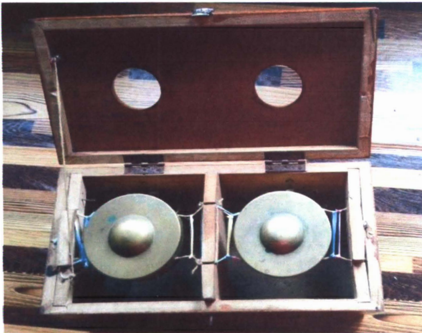
Gambar 4 : Mong