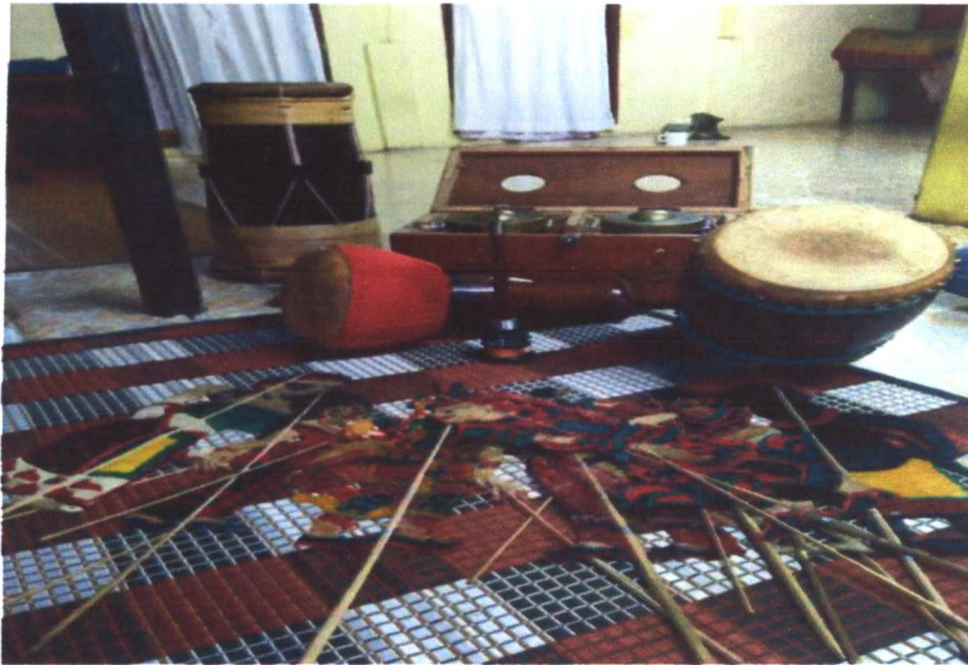
Gambar 7 : Alatan Wayang Kulit Sri Nerang Kedah