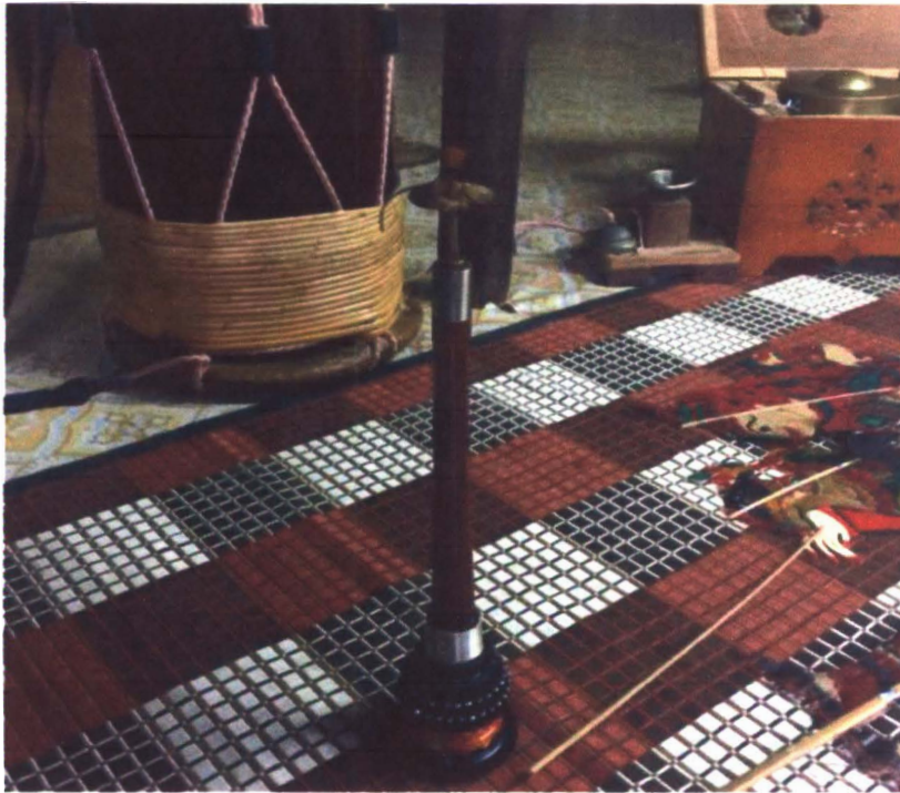
Gambar 5 : Serunai