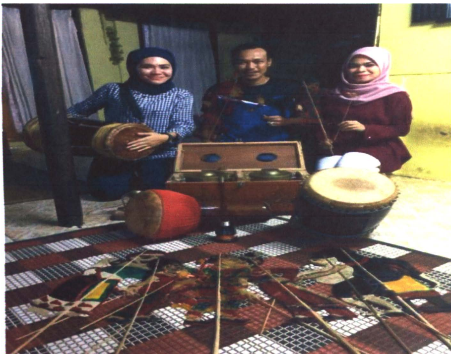
Gambar 8 :Bersama Tok Dalang Wayang Kulit Sri Nerang Kedah