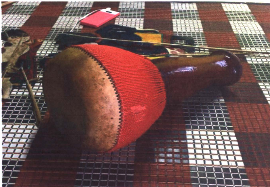
Gambar 2 : Gedombak