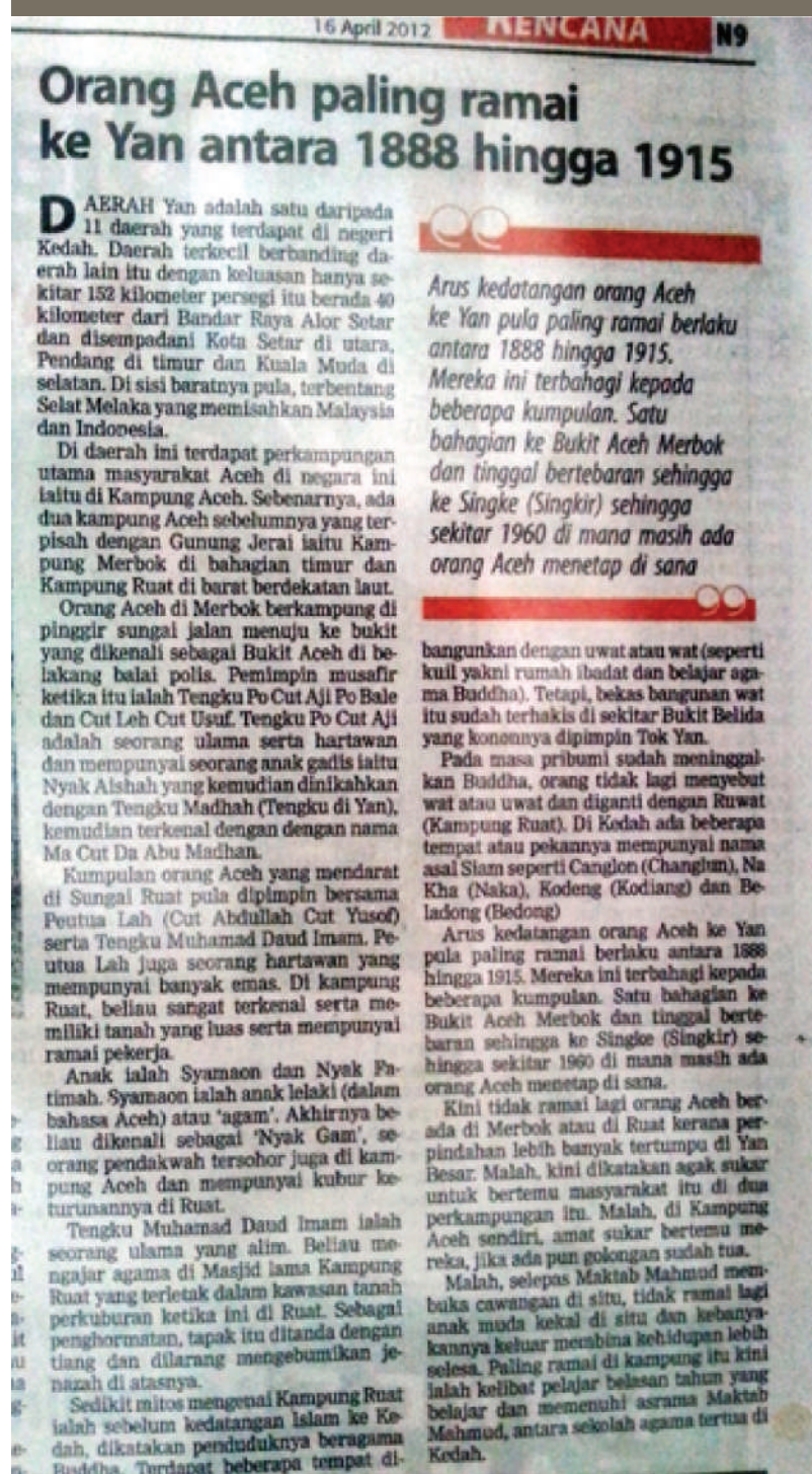
Gambar 5.2: Keratan akhbar yang melaporkan penghijrahan warga Aceh ke Kedah seperti yang dipamerkan di KAMC

“Terdapat dua versi berbeza yang menceritakan kedatangan masyarakat Aceh di Yan, Kedah.”