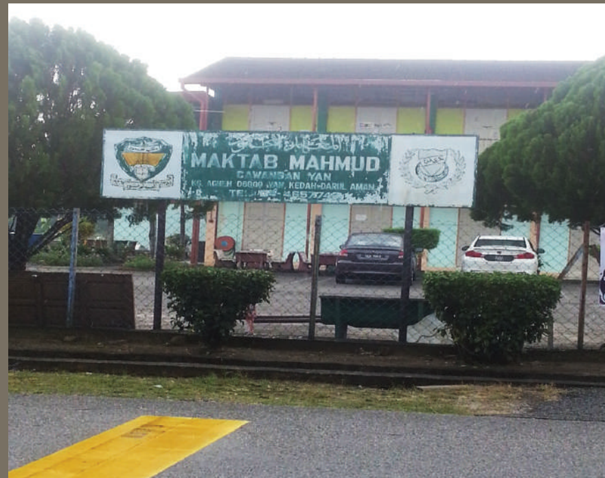
Gambar 5.4: Maktab Mahmud Cawangan Yan yang menggunakan tapak asal Sekolah Agama Attarbiah Addinniah Al Auladiah

“ Kaum ibu telah memainkan peranan utama dalam menjayakan projek ‘segenggam beras’ sehingga memberikan impak kepada pembangunan ekonomi masyarakat Aceh.”