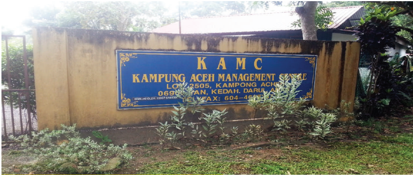
Gambar 5.8: Kampung Aceh Management Centre (KAMC) yang menawarkan kemudahan kem motivasi

“ Buah belimbing buluh merupakan bahan utama yang digunakan dalam masakan masyarakat Aceh dan buah ini apabila diker- ingkan akan dikenali dengan nama asam sunti.”