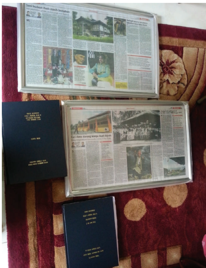
Gambar 5.12: Pelbagai keratan akhbar dan juga jilid laporan serta kajian tentang masyarakat Aceh yang disimpan di KAMC

“ Masyarakat Aceh di Yan turut bernaung dan membuat gerakan perniagaan bagi manfaat masyarakat mereka menerusi penubuhan sebuah koperasi yang diberi nama Syarikat Kerjasama Sekolah Agama Attarbiah Addin-niah Al Auladiah Kampung Aceh (SABENA), Persatuan Ikatan Masyarakat Aceh Malaysia (IMAM) dan Kampung Aceh Management Centre (KAMC).”