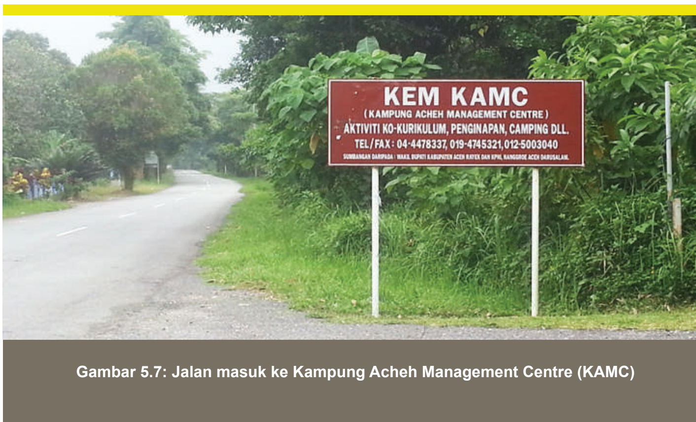
Gambar 5.7: Jalan masuk ke Kampung Aceh Management Centre (KAMC)