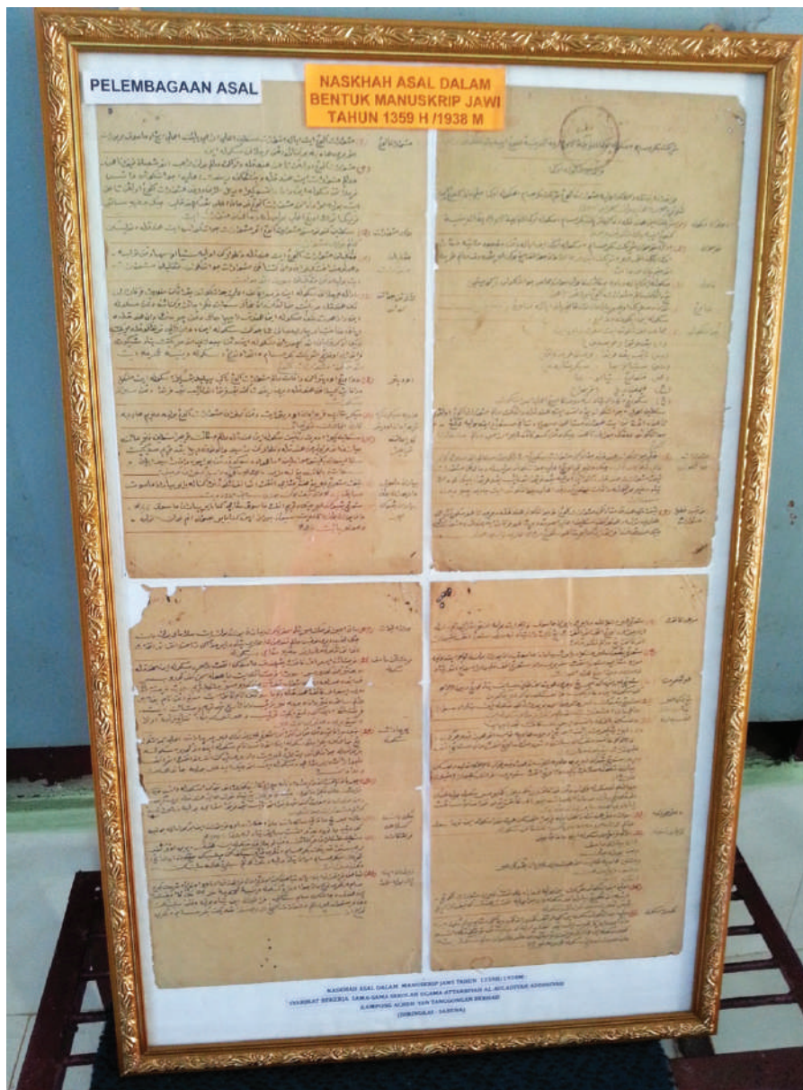
Gambar 5.6: Manuskrip asal tulisan Jawi penubuhan SABENA