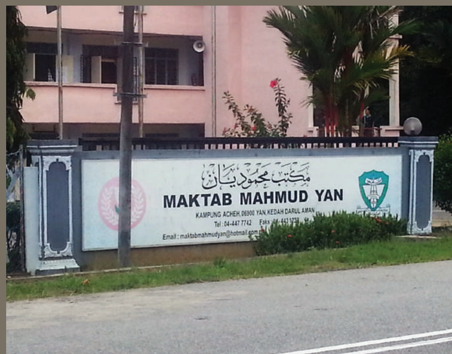
Gambar 5.5: Bangunan tambahan Maktab Mahmud Cawangan Yan yang terletak bersebelahan dengan tapak asal