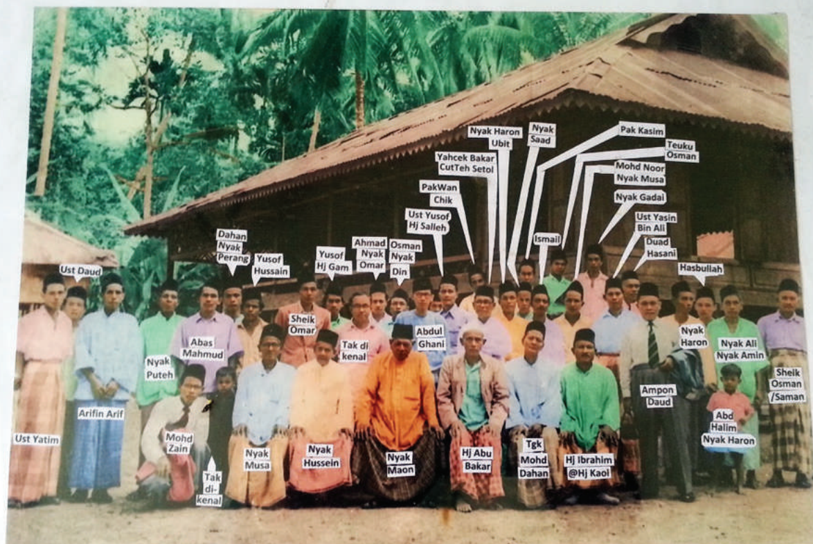
PENDUDUK KAMPONG ACHEH (GENERASI KEDUA) BERGAMBAR DI HADAPAN MADRASAH IRSYADIAH KG. ACHEH YAN KEDAH PADA TAHUN 1952 M.

Justeru mereka telah mengadakan 'duk pakat' (mesyuarat), iaitu mencari kaedah untuk menjana pendapatan. Maka projek 'segenggam beras' diperkenalkan dan telah memberikan impak kepada pembangunan ekonomi kepada masyarakat Aceh. Kaum ibu telah berperanan besar untuk menjayakan projek ini. Hal ini kerana sebelum nasi dimasak, kelazimannya pada waktu pagi dan malam kaum ibu akan mengambil segenggam beras untuk dimasukkan ke dalam bekas yang berasingan. Perkara ini dijadikan rutin dalam sehari untuk satu-satu minggu bagi setiap isi rumah. Apabila tiba hari yang ditetapkan akan ada jawatankuasa yang dilantik untuk pergi dari sebuah rumah ke sebuah rumah untuk mengambil beras tersebut. Setelah dikumpulkan beras ini akan dijual. Wang yang diperolehi digunakan untuk menampung perbelanjaan sekolah agama. Dalam pada itu, semangat orang Aceh untuk berdakwah dan berjuang ke jalan Allah begitu menebal. Ramai di kalangan mereka yang menyumbangkan tanah untuk diwakafkan dan diusahakan untuk pembangunan sekolah. Malah ada juga yang membuat keputusan untuk memberikan hasil getah yang diterima untuk satu-satu hari dalam sebulan ke sekolah agama. Selain itu, ada juga di kalangan orang Aceh ini yang membuka ladang lada, buah pala dan cengkik sebagai tanaman tradisi bagi meneruskan kelangsungan hidup.