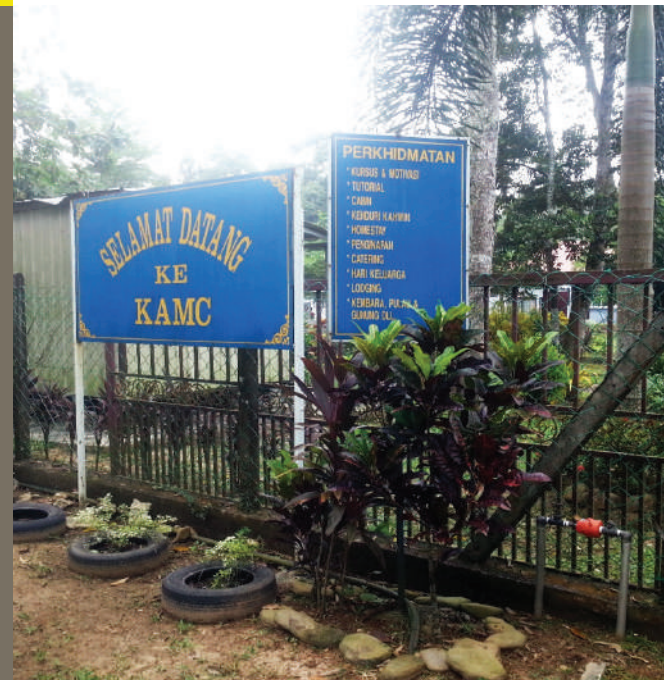
Gambar 5.9: Antara perkhidmatan lain yang turut ditawarkan di KAMC

“ Buah belimbing buluh merupakan bahan utama yang digunakan dalam masakan masyarakat Aceh dan buah ini apabila diker- ingkan akan dikenali dengan nama asam sunti.”