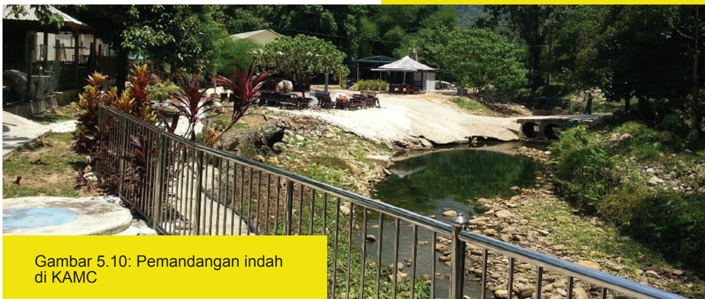
Gambar 5.10: Pemandangan indah di KAMC