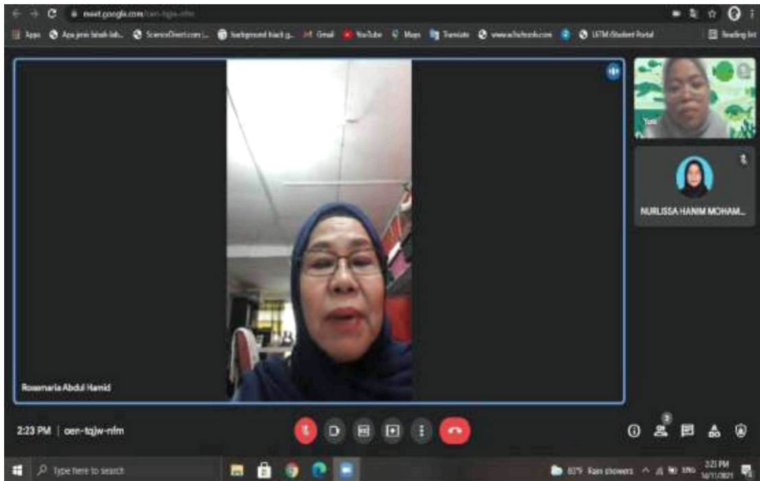
Sesi temubual awal pertama bersama tokoh menerusi Google Meet