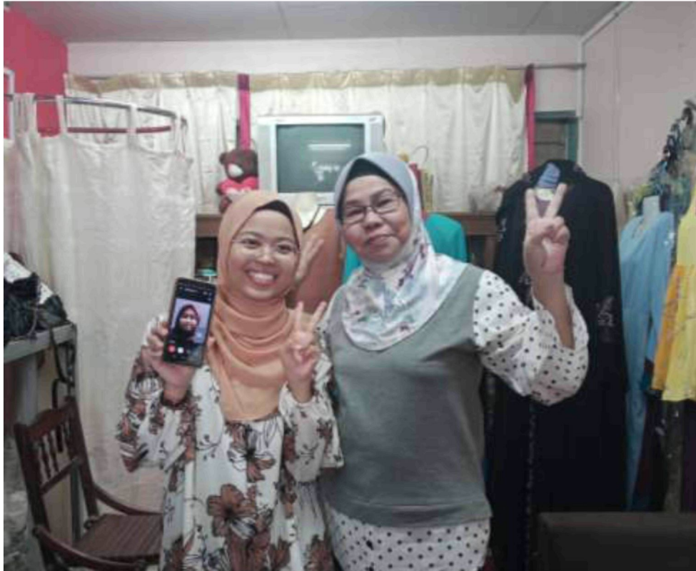
Sesi bergambar bersama tokoh setelah selesai sesi kedua temubual awal yang bertempat di kediaman tokoh di Kota Bharu, Kelantan dimana kami mengumpul bahan mengenai tokoh