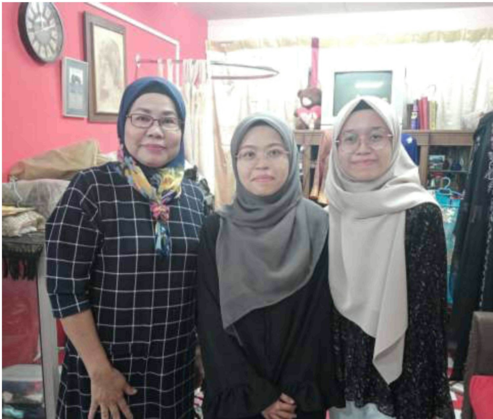
Sesi bergambar bersama tokoh selepas selesai temubual sebenar sesi pertama yang berlangsung di kediaman tokoh di Kota Bharu, Kelantan.