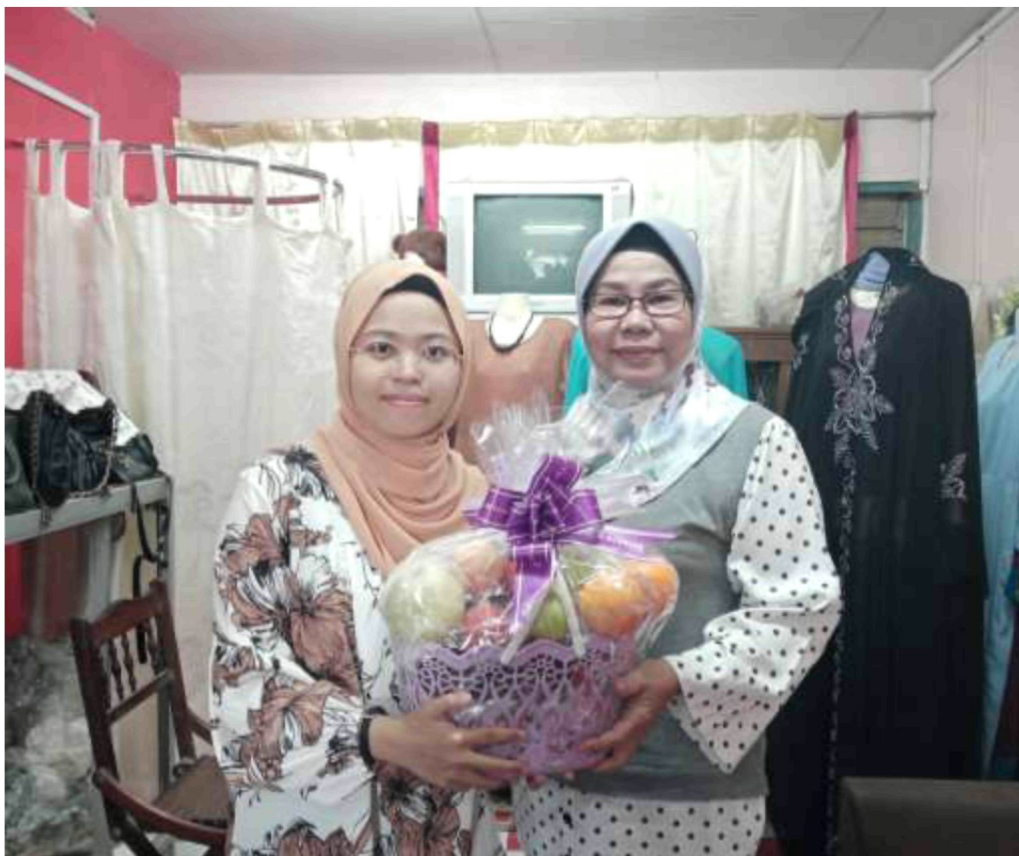
Memberikan buah tangan kepada tokoh sebagai tanda penghargaan dan kerjasama dalam melaksanakan projek kajian sejarah lisan