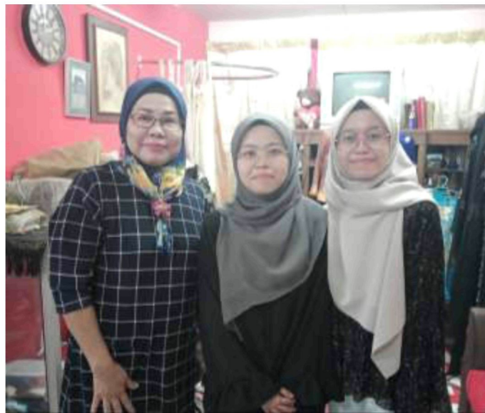
Bersama tokoh ketika sesi temubual

Platform yang akan digunakan dalam proses temubual ialah secara bersemuka dan untuk dalam talian ialah melalui aplikasi Zoom bagi memudahkan lagi proses temubual nanti.