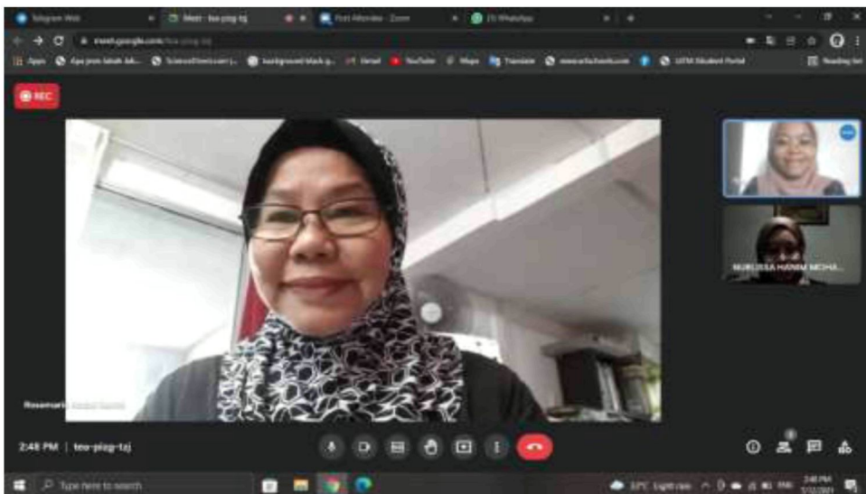
Temubual sesi kedua bersama tokoh melalui aplikasi Google Meet