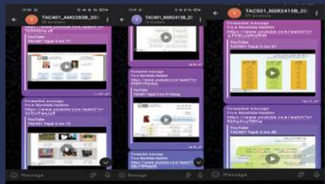
Perkongsian video dari YouTube ke dalam kumpulan Whatsapp kelas mengikut kod kursus

Antara kebaikan dan manfaat menggunakan video YouTube dan TikTok dalam pembelajaran sebagai bahan tambahan adalah dapat meraikan gaya pembelajaran pelajar yang pelbagai (visual, auditori dan kinestetik), pelajar berpeluang mempelajari bahasa Arab dari pakar di seluruh dunia. Pelajar berpeluang mempelajari bahasa dari penutur asal bahasa Arab, pelajar boleh menambah maklumat tambahan mengenai bahasa Arab secara percuma tanpa had masa dan dapat menambah kemahiran pembelajaran pelajar secara sendiri menggunakan video yang interaktif dan menarik. Baharudin dan Khodari (2022) dalam kajian mereka mengenai tahap penggunaan video YouTube dan motivasi pelajar terhadap pembelajaran bahasa Arab menggunakan video YouTube ini menunjukkan bahawa YouTube bermanfaat dalam menaikkan motivasi pelajar untuk melatih kemahiran mendengar bahasa Arab mereka. Perkara ini turut disokong oleh Aboudahr (2020) yang mendapati YouTube memberikan impak yang sangat penting bagi meningkatkan kemahiran mendengar pelajar yang bukan penutur asli bahasa Arab.