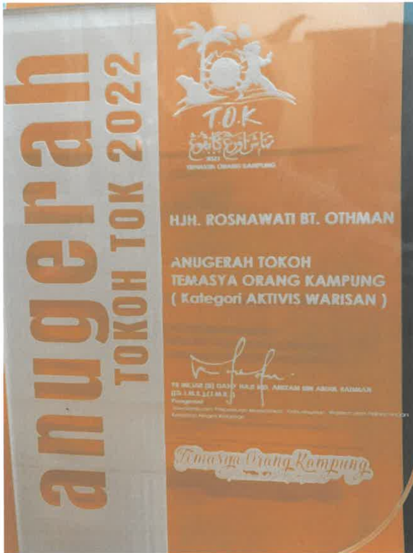
Gambar 7 : Sijil Anugerah Tokoh Temasya Orang Kampung