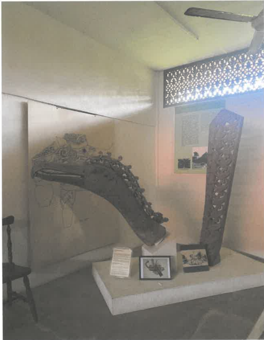
Gambar 5: Antara ukiran kayu yang terdapat dalam Galeri Akademi Nik Rashiddin