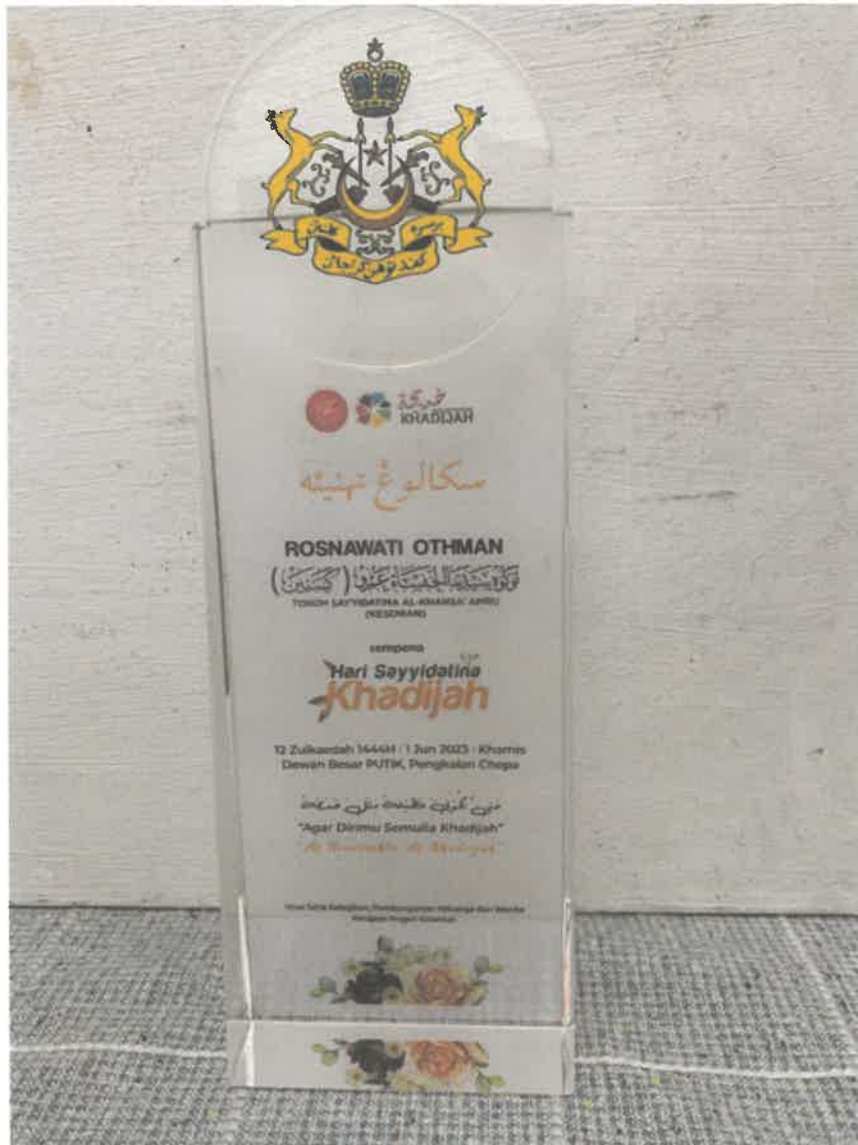
Gambar 8: Trofi Tokoh Sayyidatina Al-Khansa' Amru (Kesenian) sempena Hari Sayyidatina Khadijah