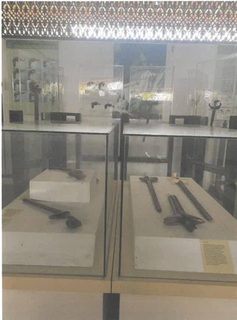
Gambar 4 : Koleksi beberapa keris dalam Galeri Akademi Nik Rashiddin