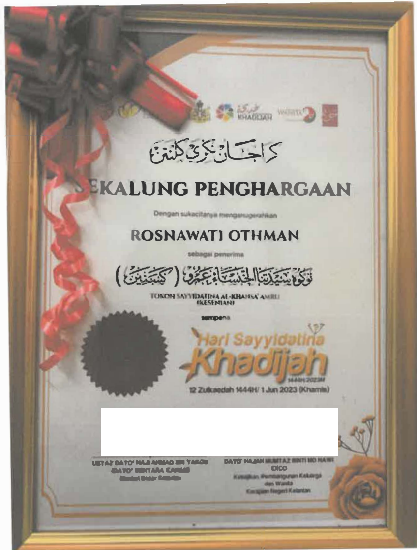
Gambar 6: Sijil Anugerah Tokoh Sayyidatina Al-Khansa' Amru