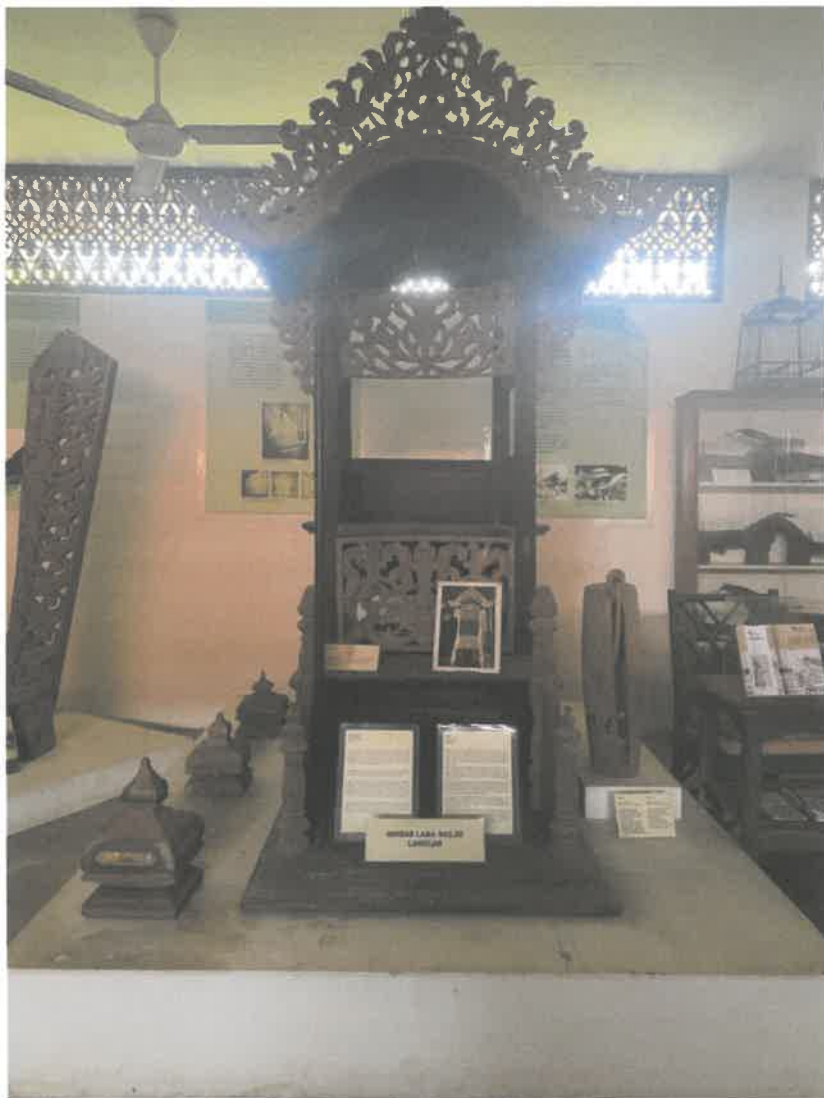
Gambar 3: Ukiran Mimbar Lama Masjid yang terdapat dalam Galeri Akademi Nik Rashiddin