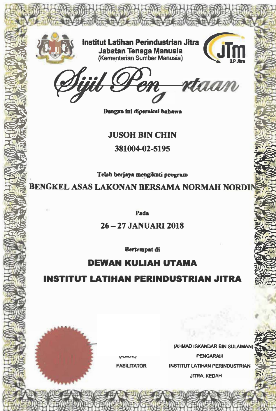
Gambar 5 : Sijil Penyertaan Bengkel Asas Lakonan Bersama Normah Nordin