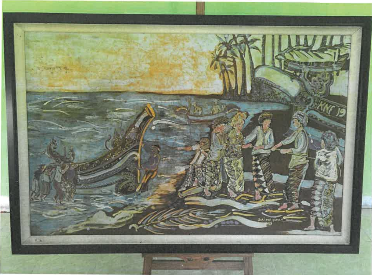
Gambar 7: Corak motif batik yang bertemakan zaman dahulu kala