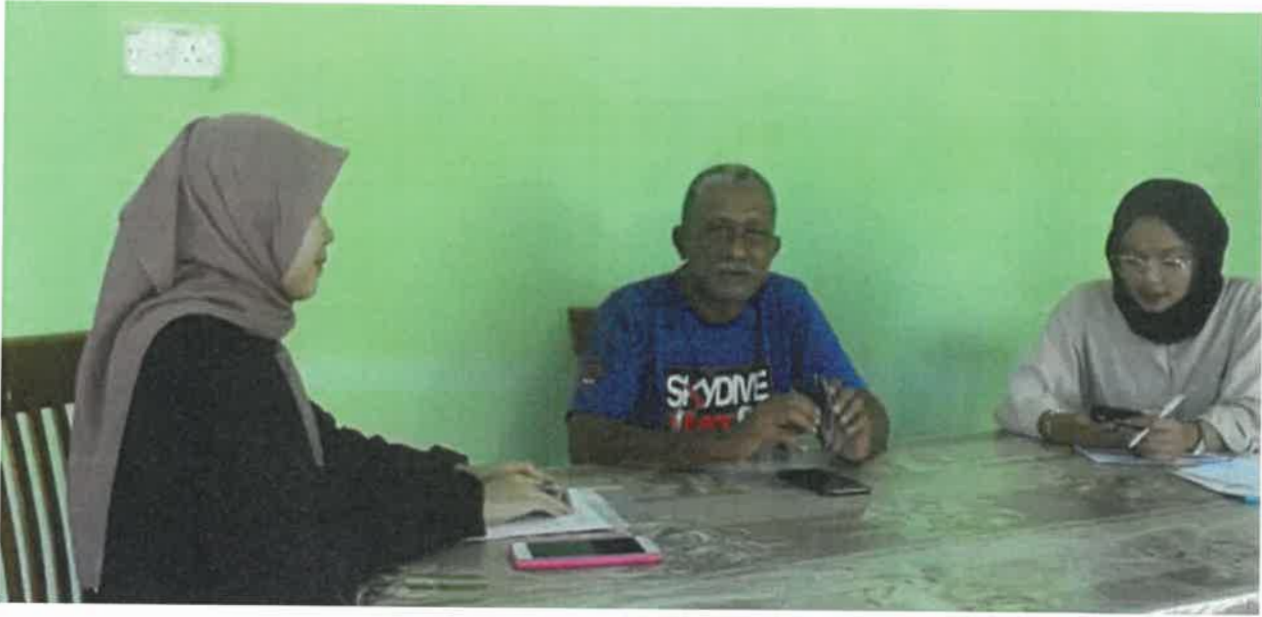
Gambar 1: Sesi temubual bersama tokoh seni batik