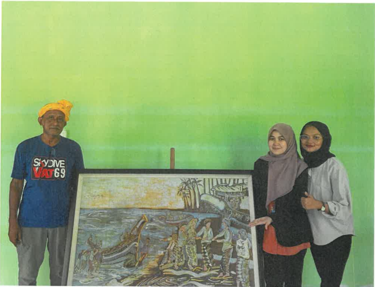
Gambar 3: Motif lukisan terkenal yang dihasilkan oleh tokoh seni