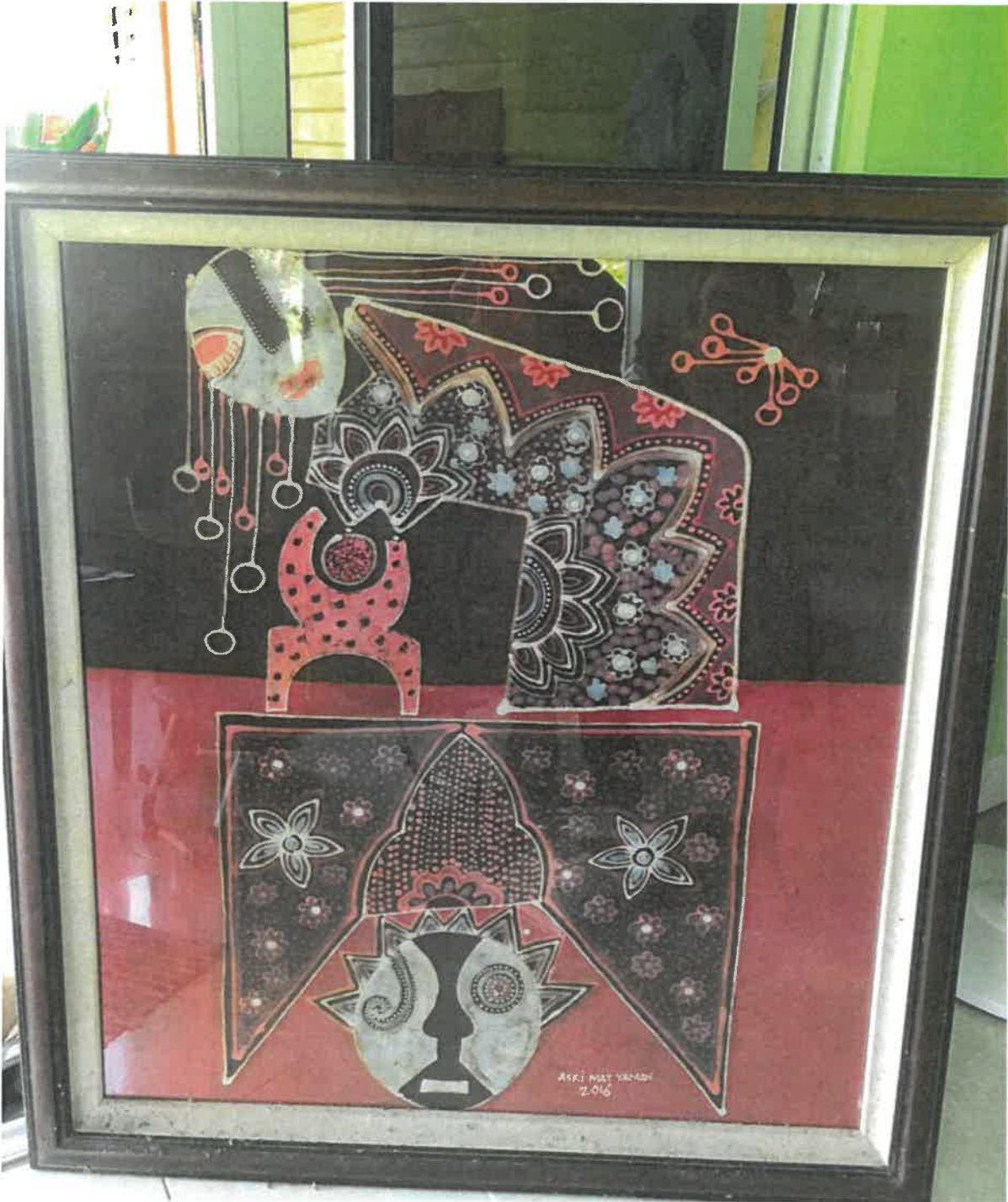
Gambar 10: Antara corak batik yang rumit dihasilkan