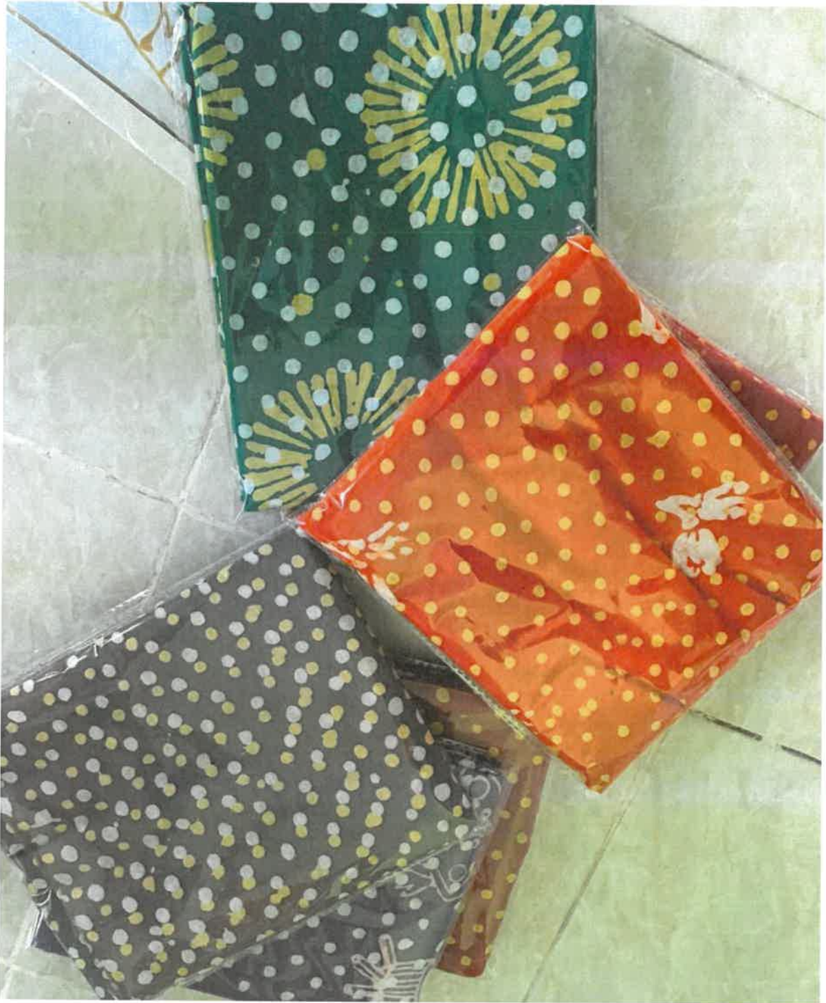
Gambar 11: Semutar batik yang siap dihasilkan untuk dijual