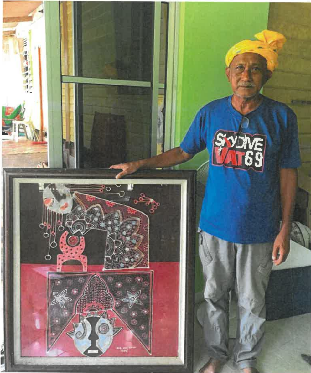
Gambar 4: Corak batik yang terkenal di kalangan setempat