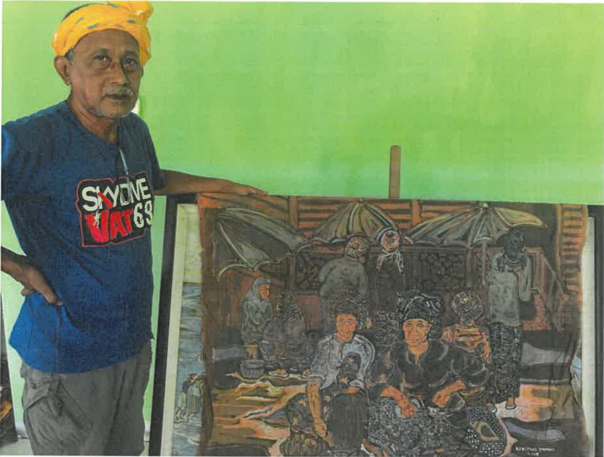
Gambar 5: Lukisan yang dihasilkan oleh tokoh seni