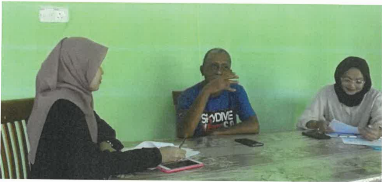
Gambar 2: Sesi temubual bersama tokoh seni batik