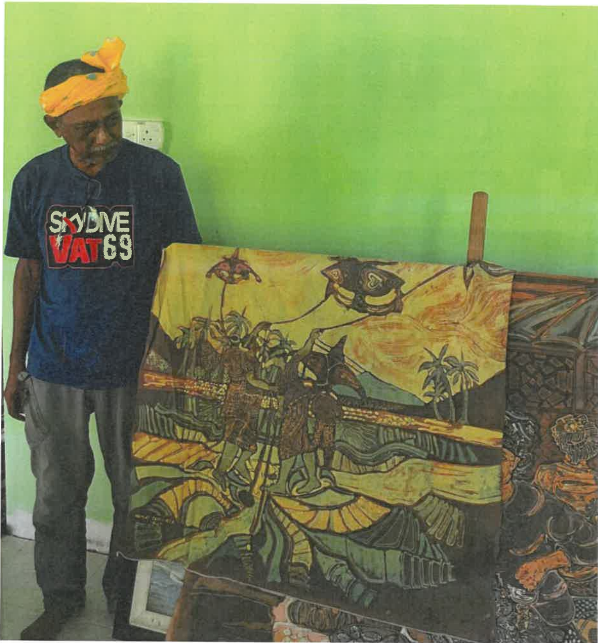
Gambar 6: Motif batik bertemakan wau bulan