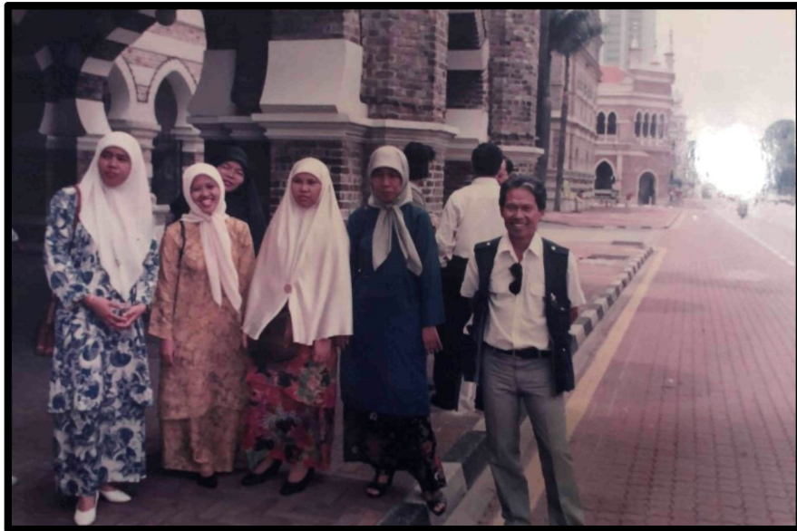
Rajah 7: Wak bersama rakan kerja di ABIZA Group