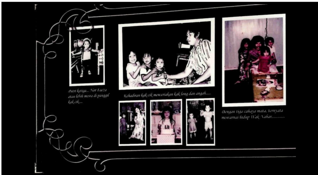
Rajah 19: Anak-anak Wak semasa kecil