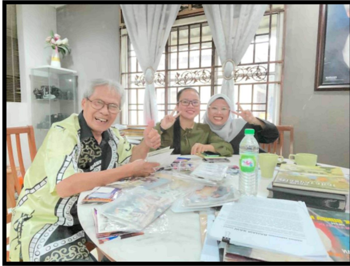
Rajah 26: Sesi temubual bersama tokoh