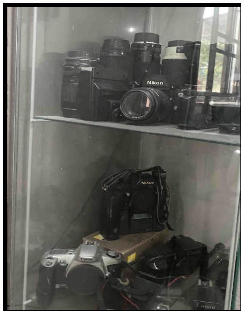
Rajah 25: Koleksi kamera tokoh