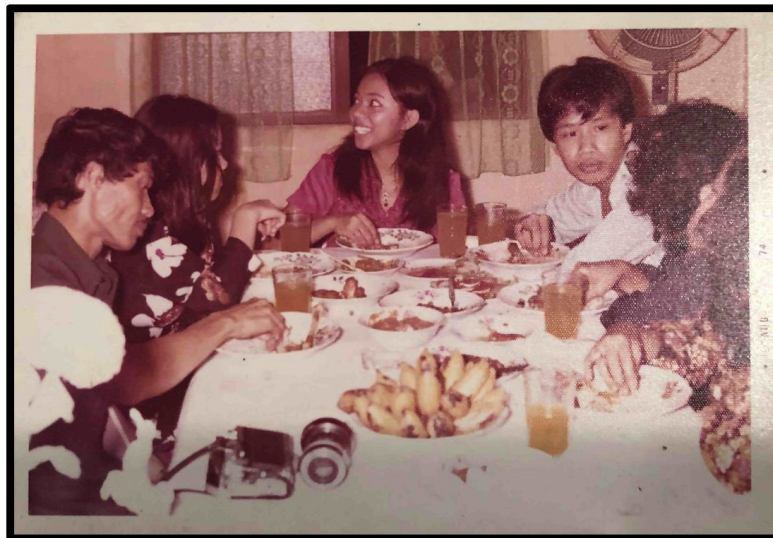
Rajah 3: Wak semasa bekerja dengan Mastika Publisher