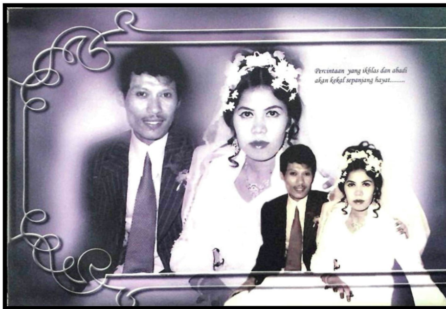
Rajah 13: Perkahwinan Wak dan isteri tercinta