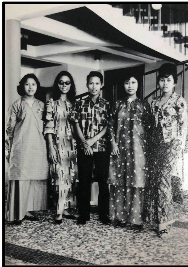
Rajah 5: Wak bersama rakan Persatuan Pemuda Pemudi Singapura