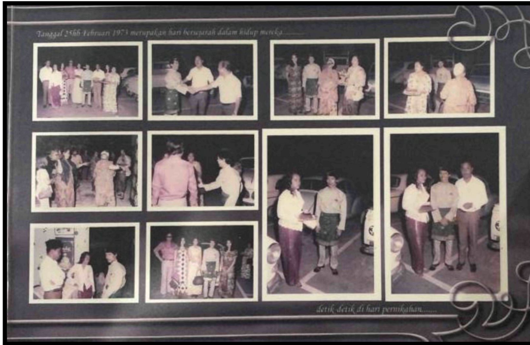
Rajah 14: Di Hari Pernikahan Wak dan pasangan