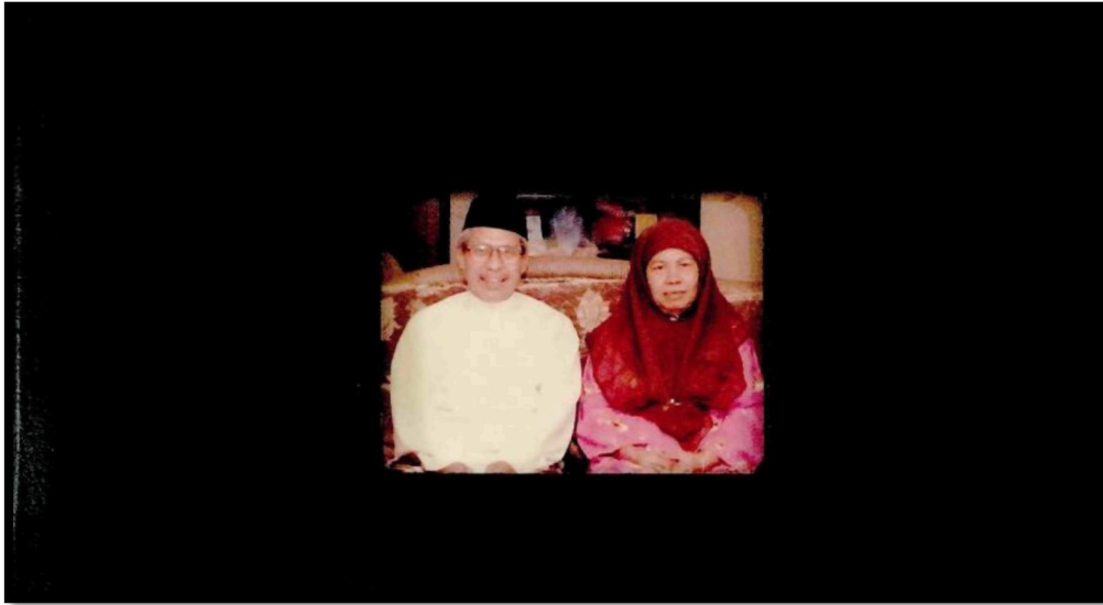
Rajah 16: Wak dan isteri tercinta