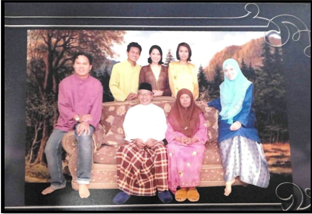
Rajah 20: Wak sekeluarga