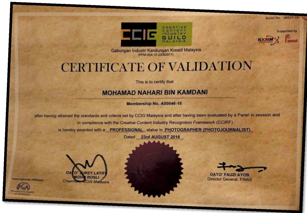
Rajah 22: Sijil Penghargaan sebagai "Professional Photographer"