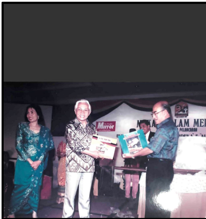
Rajah 11: Majlis Pelancaran Buku Sarawak