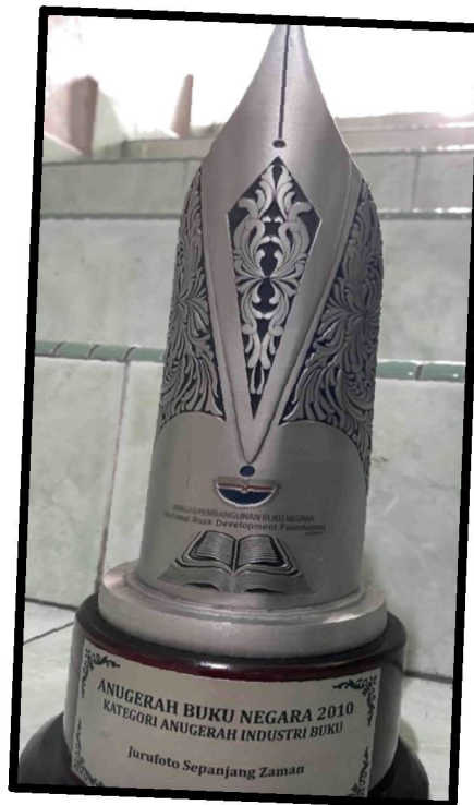
Rajah 23: Trofi Amugerah Buku Negara