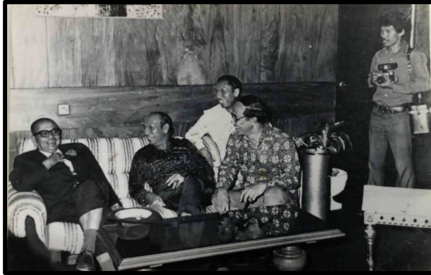
Rajah 10: Gambar bersama Tunku Abdul Rahman Putra Al-Haj, Perdana Menteri Malaysia yang pertama