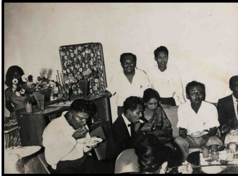
Rajah 4: Wak dan rakan Persatuan Pemuda Pemudi Singapura