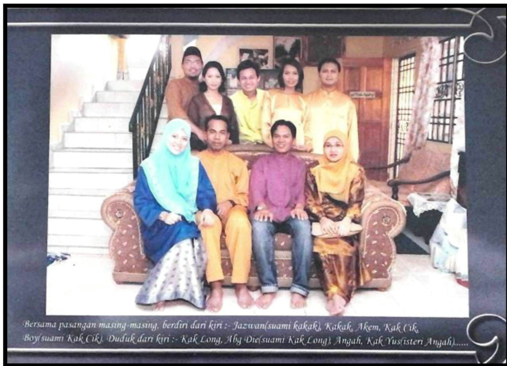
Rajah 21: Anak-anak Wak bersama pasangan masing-masing