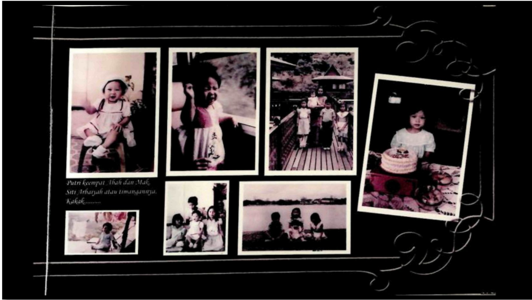
Rajah 18: Anak-anak Wak semasa kecil