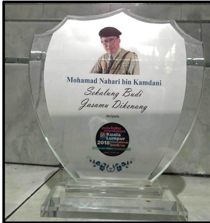
Rajah 24: Pingat Penghargaan