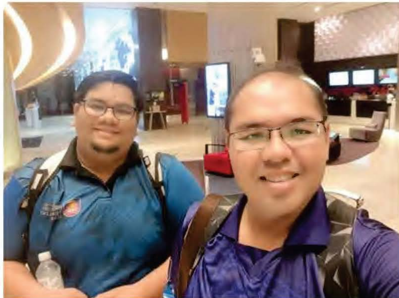
Gambar 1: Konsep Hotel Novotel Taipei Taoyuan International Airport yang mewah dan berkonsep minimalis

Penulis juga sempat menggunakan keretapi yang menghubungkan antara bandar utama di sekitar Taiwan. Penulis juga memerhatikan keadaan tempat menunggu di stesen keretapi yang sangat bersih dan teratur. Namun, berbeza dari apa yang dilihat dari kaca mata, penulis ditemani dengan bau yang tidak menyenangkan semasa merentasi kota untuk menuju ke bangunan Taipei 101. Terdapat bau tajam dan hancing di sepanjang laluan pejalan kaki, di dinding-dinding bangunan serta sepanjang kawasan luar kota. Penulis cuba untuk berfikir positif memikirkan kemungkinan bau tersebut adalah dari bau