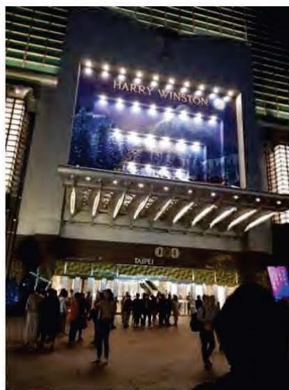
Gambar 2: Panorama persekitaran Bangunan Taipei 101.

ejen peluntur, pencuci atau sabun yang berbau tajam dan tidak menyenangkan.