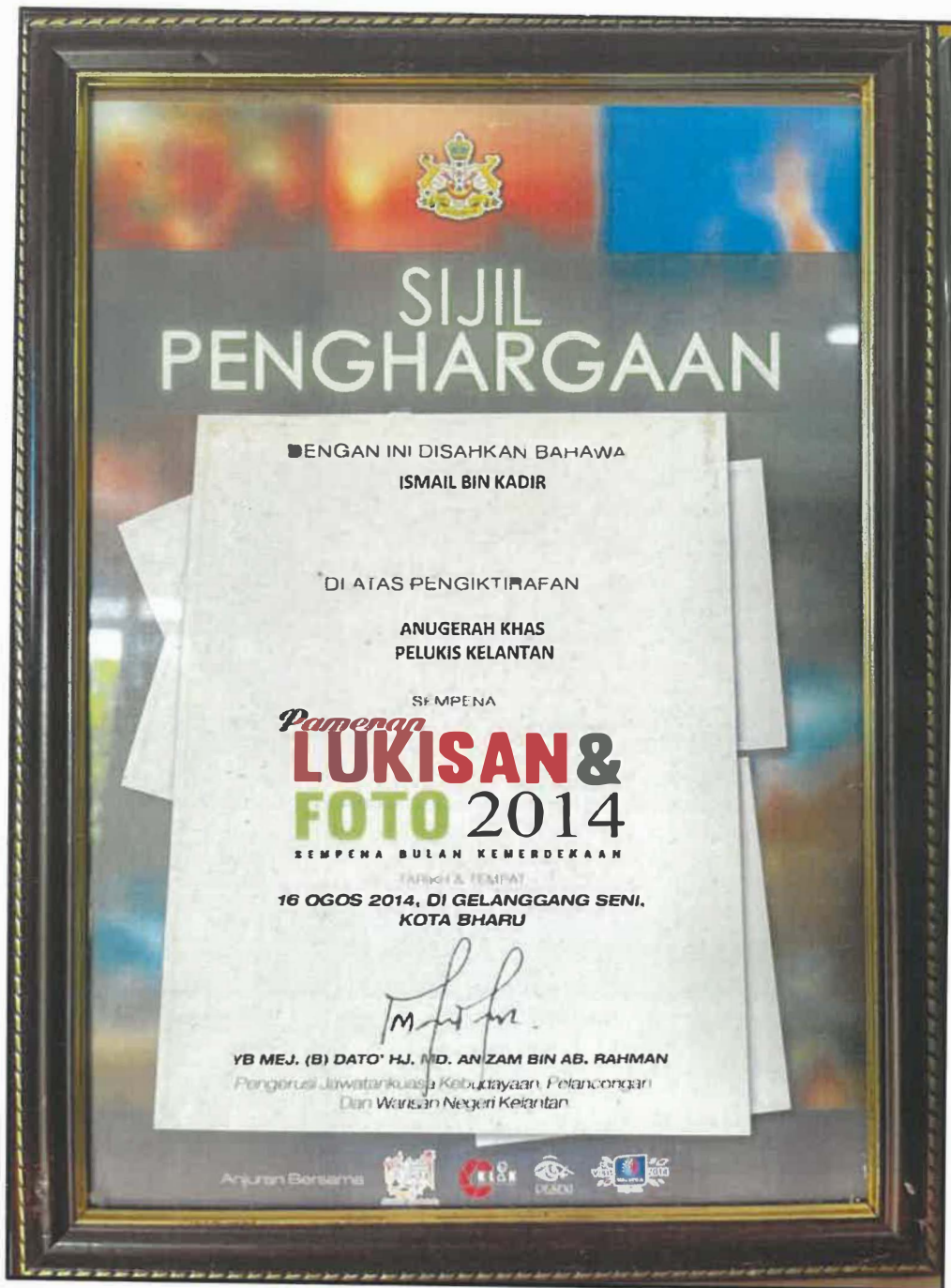
Gambar 2: Sijil Anugerah Khas Pelukis Kelantan