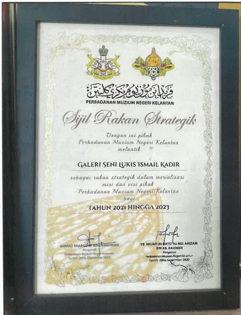
Gambar 1: Sijil Rakan Strategik daripada Perbadanan Muzium Negeri Kelantan