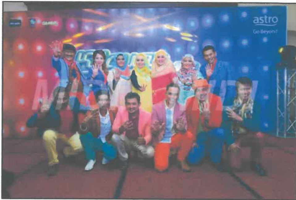
Bersama finalis Kilauan Emas 4