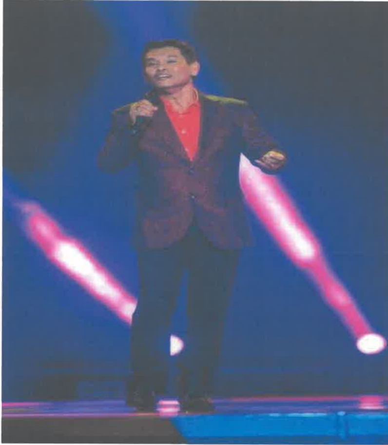
Mendengarkan lagu dalam pertandingan Kilauan Emas 4