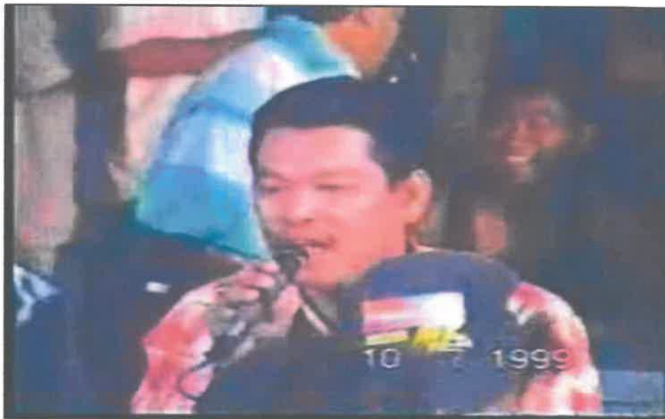
Semasa menghiburkan peminat pada tahun 1999