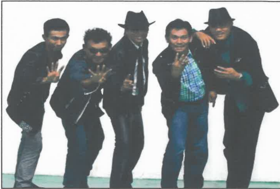
Ketika menyertai Kilauan Emas 4