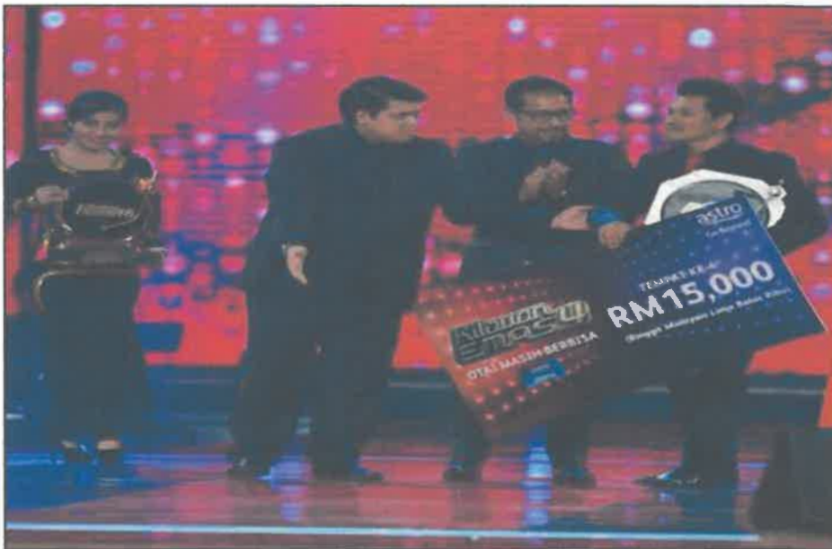
Ketika memenangi anugerah Cabaran 30 Hari Nestle Omega Plus dalam pertandingan Kilauan Emas