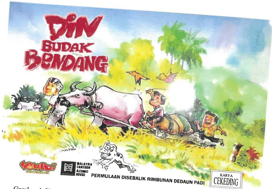
Gambar 4: Komik pertama yang dihasilkan oleh Encik Zainudin atau Cekeding berkisah tentang dirinya