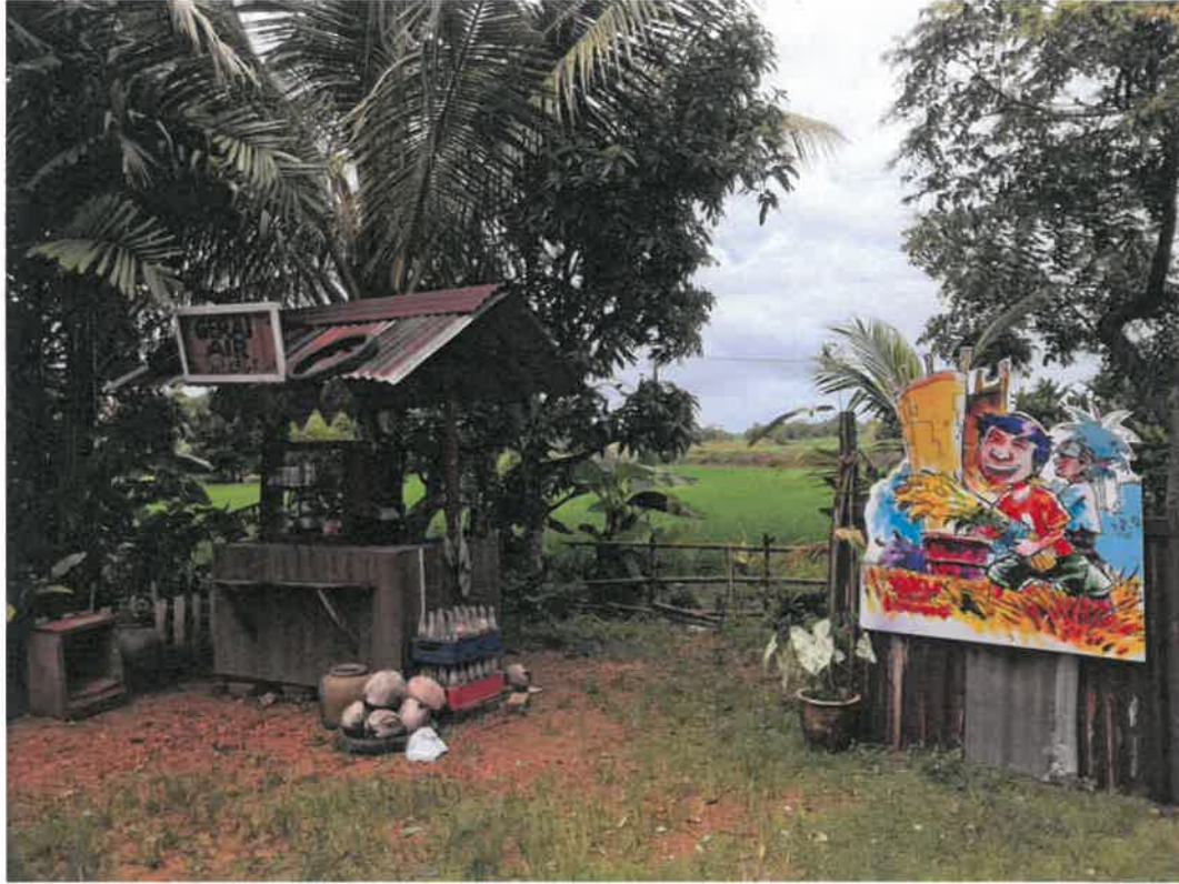
Gambar 2: Kawasan rumah kediaman Encik Zainudin