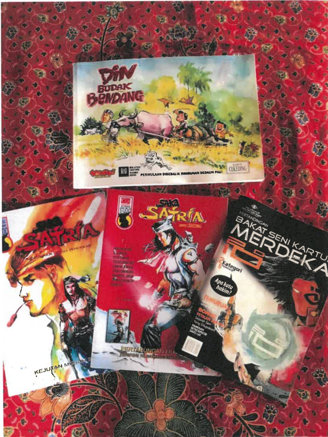
Gambar 5: Koleksi hasil pencapaian bel dalam melukis komik