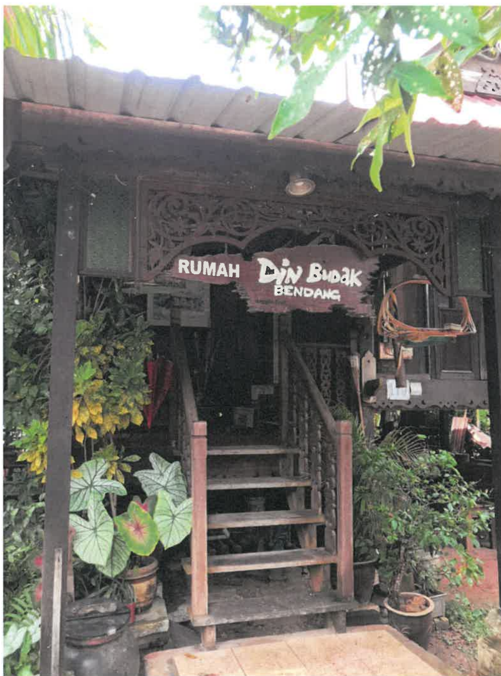
Gambar 1: Rumah kediaman Encik Zainudin