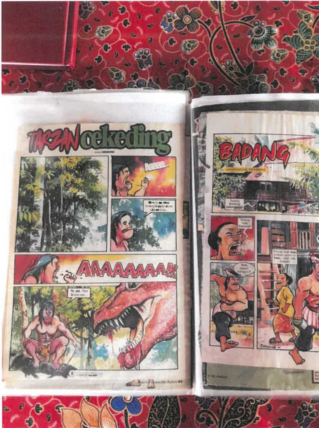
Gambar 6: Antara lukisan-lukisan komik yang dihasilkan oleh Encik Zainudin atau Cekeding.